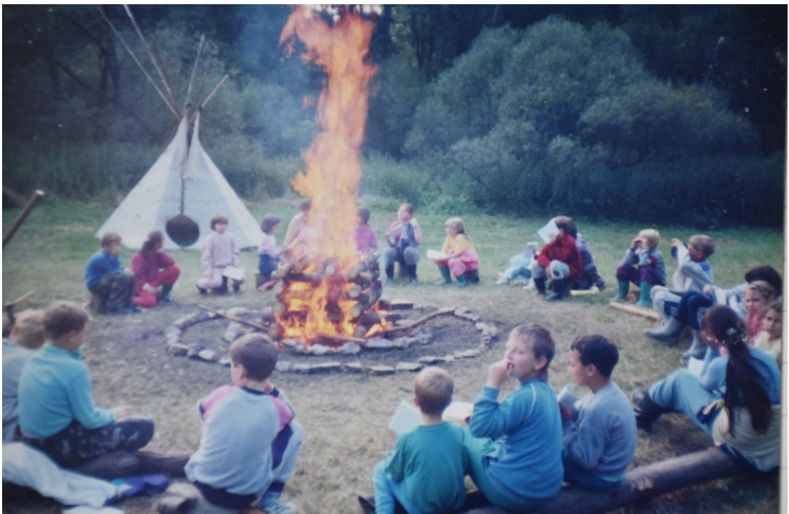
Obrázek č. 2