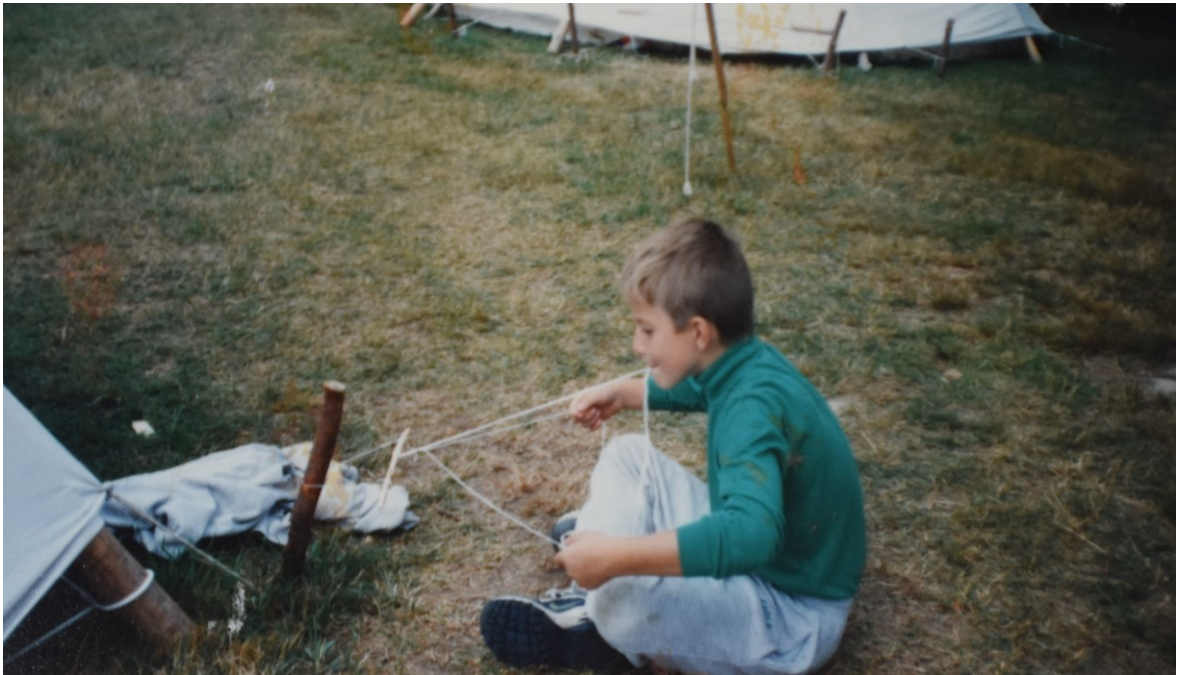
Obrázek č. 5