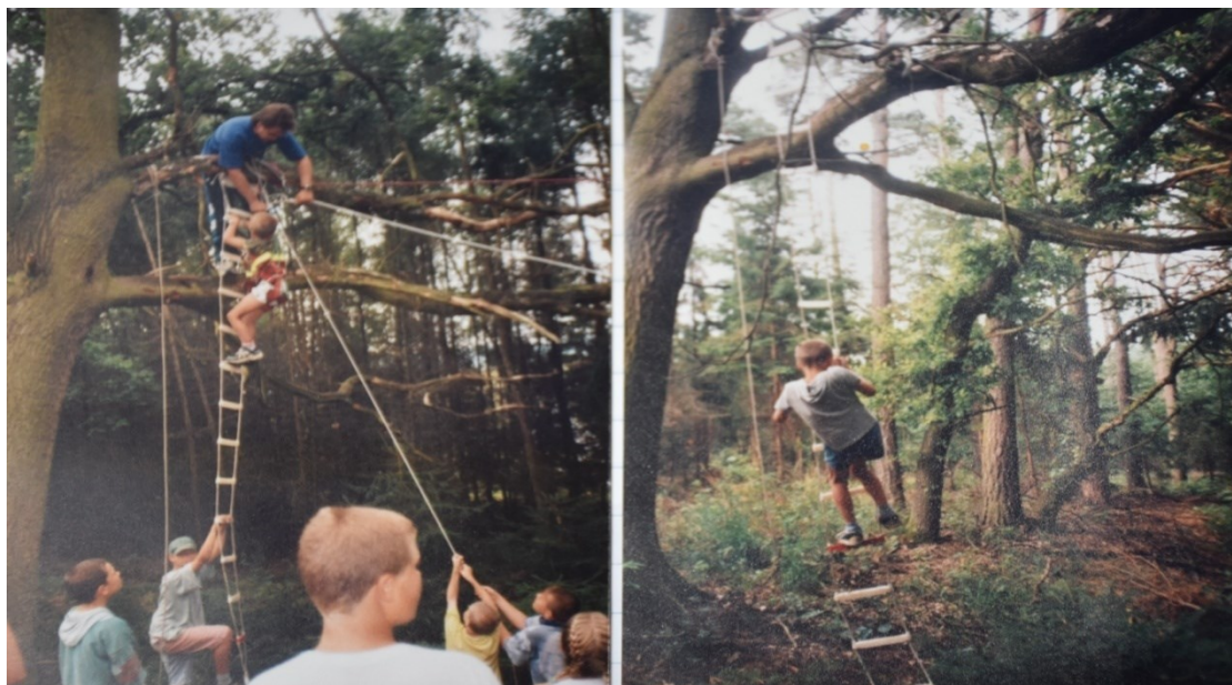
Obrázek č. 7