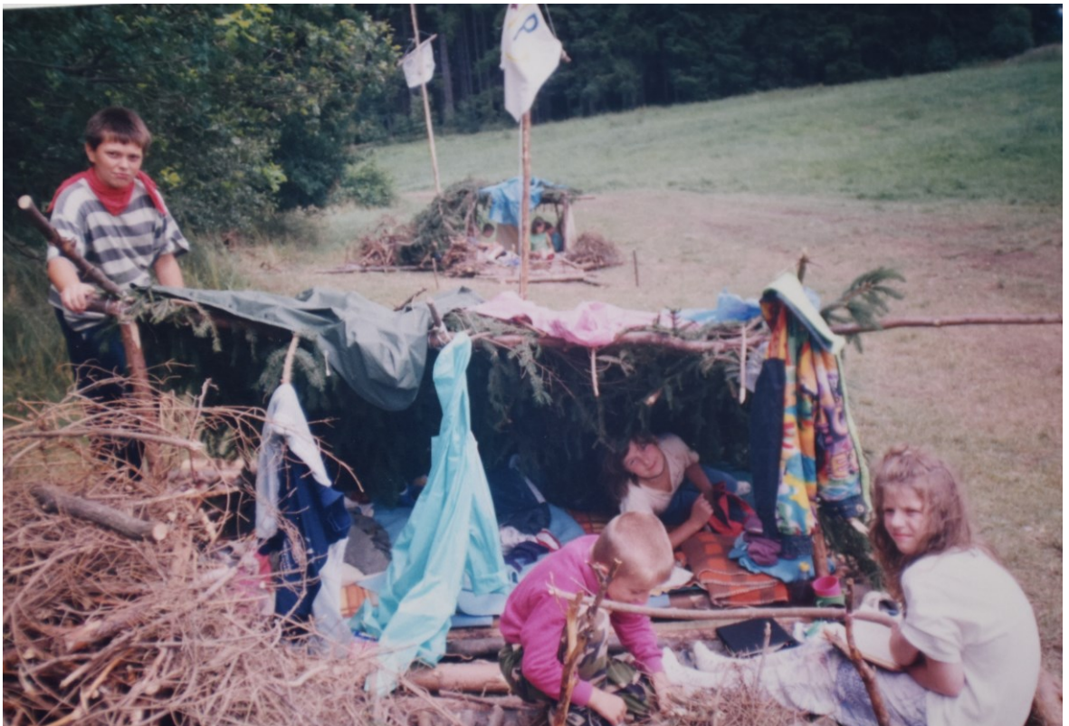
Obrázek č. 6