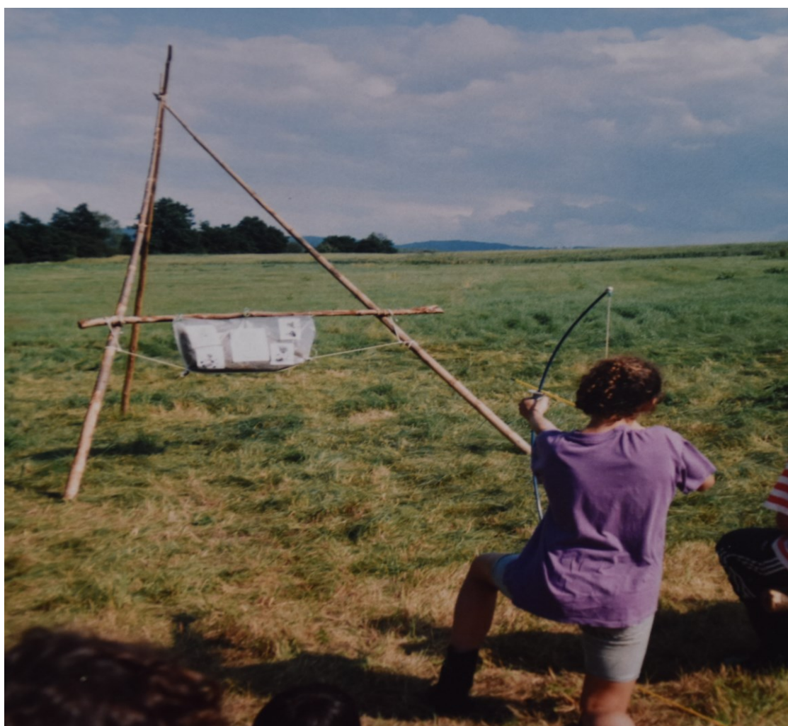
Obrázek č. 8