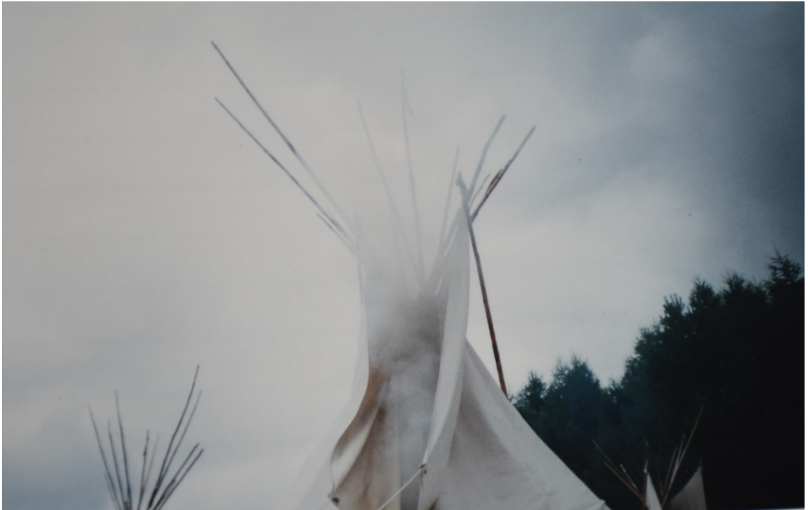
Obrázek č. 3