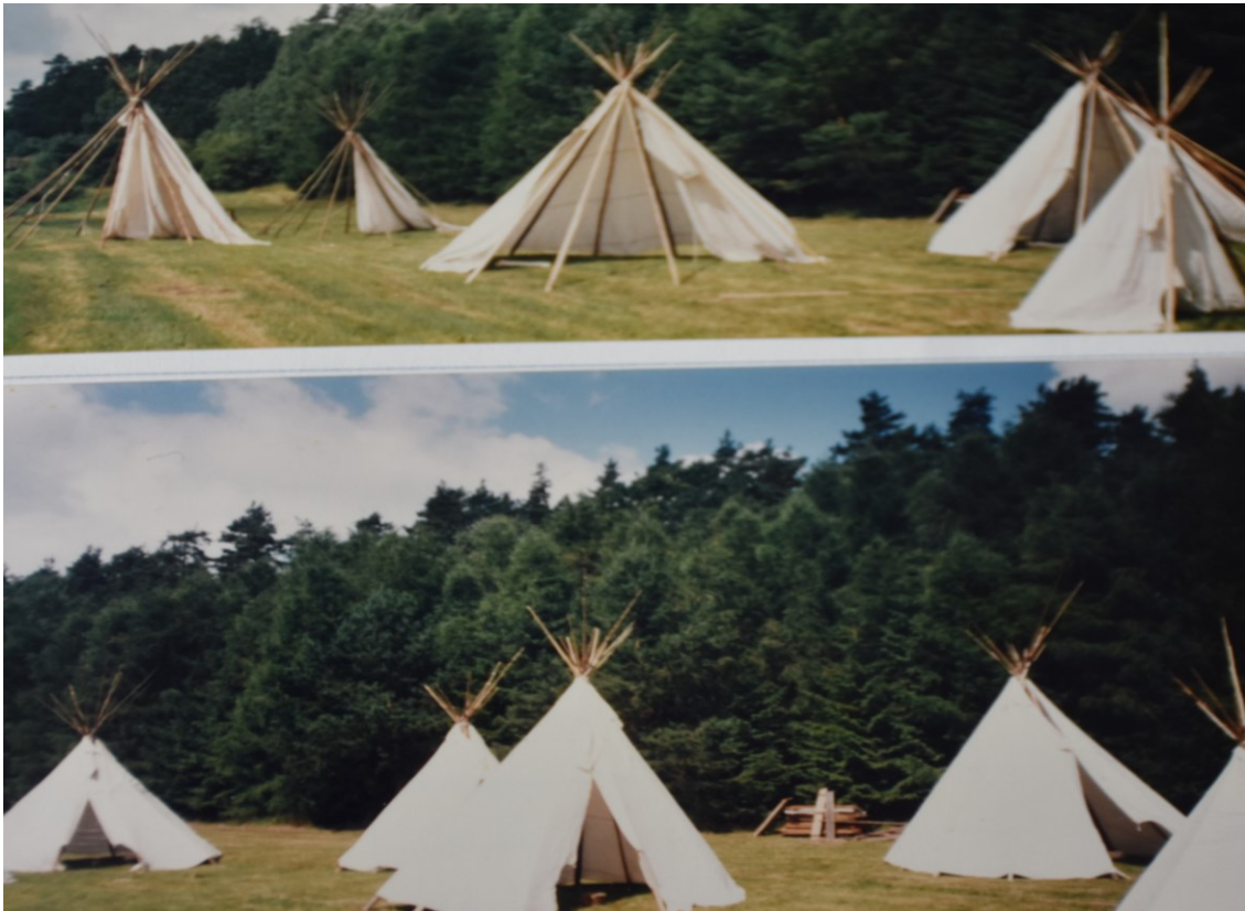
Obrázek č. 1