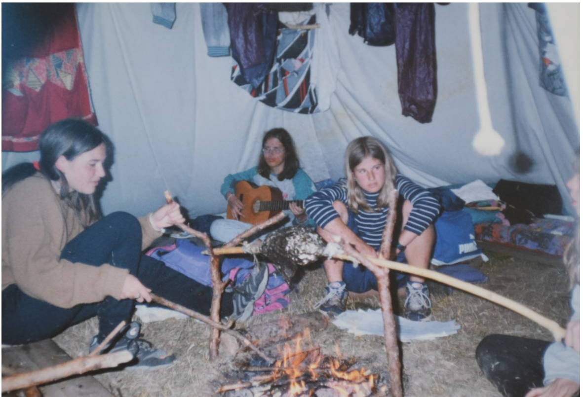
Obrázek č. 4