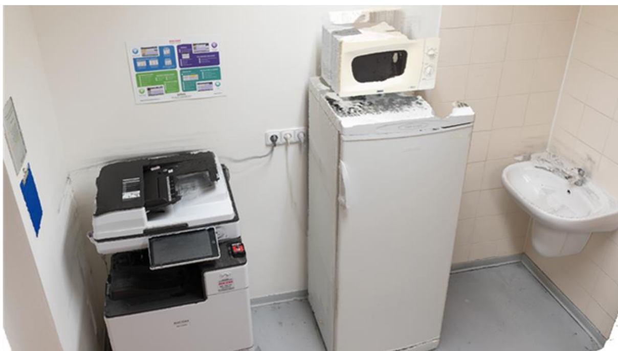
Obr. 1 - Nekvalitně 3D rekonstruovaná část modelu K001

V rámci experimentu byla uskutečněna 3D rekonstrukce stejného prostoru dvěma přístupy. Cílem experimentu bylo v rámci jednotlivých přístupů využít odlišného postupu sběru a následného zpracování dat. Jelikož je z renderovaných 2D náhledů obtížné kvalitativně posuzovat parametry výsledných modelů, byly pro potřeby budoucích experimentů a vyjádření základních aspektů na základě vizuálního posouzení formulovány následující závěry. Výsledný experimentu K001 dosahuje vyšší kvality rekonstrukce tvaru i textury modelové scény. Některé části scény však nedosahují požadované kvality ani v případě využití standardního přístupu. Skenování těchto povrchů s využitím sublimačního spreje je obsaženo v dodatkové kapitole 7.3. Využití rychlého přístupu však nabízí ještě mnoho dalších experimentů, počínaje sběrem dat, až po nastavení konečné rekonstrukce. Potenciál je sledován zejména v kombinaci rychlého přístupu a využití dalších světelných zdrojů, které by zajišťovaly homogenní osvětlení snímané scény, přesnější pozicování fotoaparátu, více skenovacích cyklů a další změny, které mají ambici zvýšit kvalitu výsledného modelu.