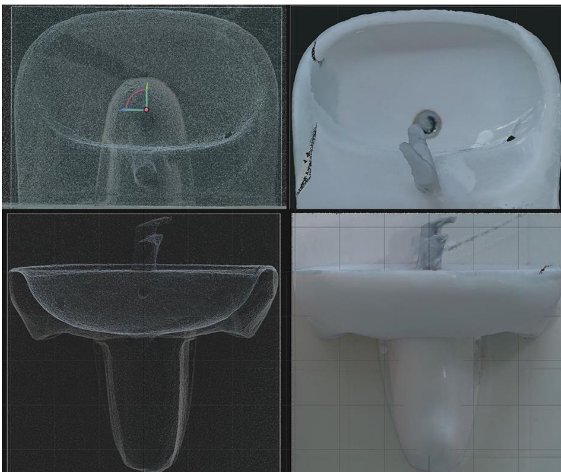
Obr. 2 - 3D model umyvadla včetně baterie, demonstrace výsledků skenování s využitím úpravy povrchů sublimačním zmatňujícím sprejem

Záměrem experimentu bylo ošetřit zmíněné části místnosti speciálním sublimačním sprejem, který pokryje povrch rovnoměrnou tenkou zmatňující vrstvou a tím umožní jeho nasnímání. Podobný sublimační nástřík lze ve větším měřítku nanášet s využitím airbrushové pistole. Využití zmatňujících nástříků je doporučováno zejména v kombinaci s metodami laserového skenování. Nevýhodou je znemožnění sejmání informací o textuře povrchu, ten je totiž opatřen sněhově bílou vrstvou. Rekonstrukce textury objektu byla uskutečněna pouze s využitím zdrojových snímků pořízených integrovanými HDR kamerami ToF laserového skeneru. V porovnání s původními modely K001 a K001F nebyly k rekonstrukci textury opravného modelu využity žádné další snímky. Experiment přinesl pozitivní výsledky, jelikož geometrie modelů byla rekonstruována v potřebné kvalitě pro využití v dalších procesech 3D rekonstrukce scénáře TČ ve VR.