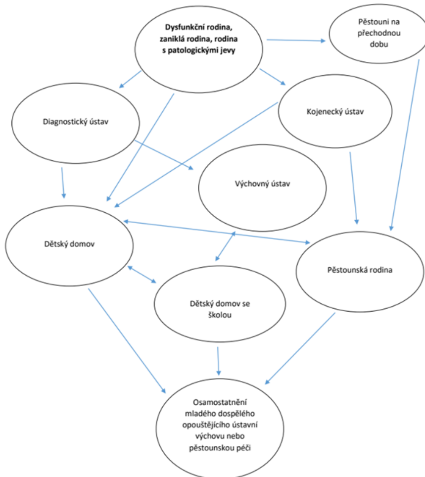
Obrázek 1 Schéma náhradní rodinné výchovy