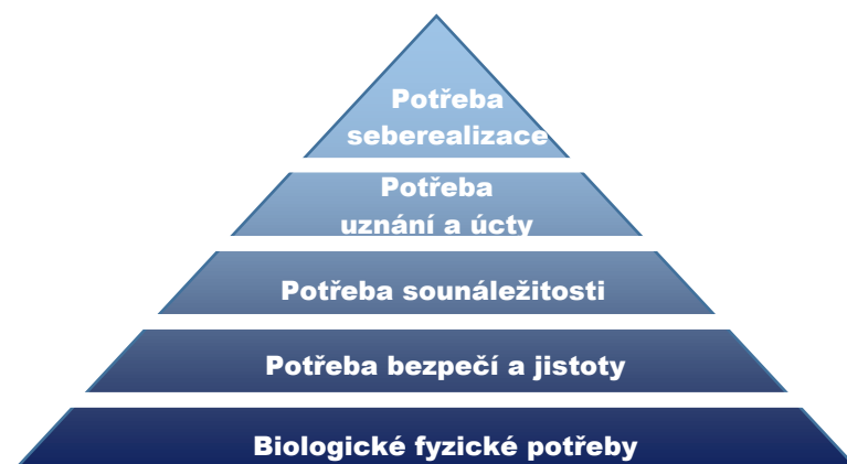
obrázek č. 1: Maslowova pyramida potřeb [vlastní tvorba]

Sám Maslow vyslovil pochybnosti o přísně stanovené hierarchii potřeb, která stále nebyla ověřena empirickým výzkumem, avšak doposud má zmíněná teorie značný vliv. Uspořádání potřeb dle Maslowa a odraz jednotlivých úrovní hierarchie nám popisuje obrázek níže.