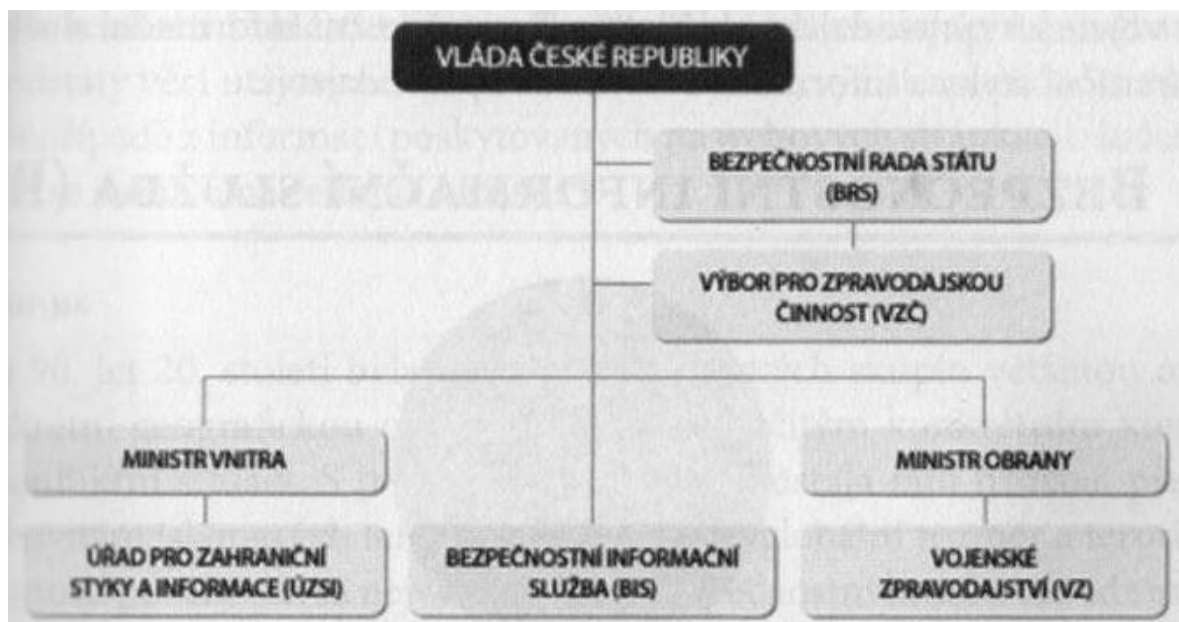
Obr. 1. Zpravodajský systém České republiky[18]

Hlavními prvky tohoto systému jsou především vláda České republiky, která má rozhodující slovo, dále pak Bezpečnostní rada státu a Výbor pro zpravodajskou činnost. Posledním článkem jsou jednotlivé zpravodajské služby, které spadají pod příslušná ministerstva. Vztahy mezi těmito subjekty mají obecně za úkol řízení, úkolování, koordinaci a kontrolu pro správnou činnost zpravodajského systému.[18]