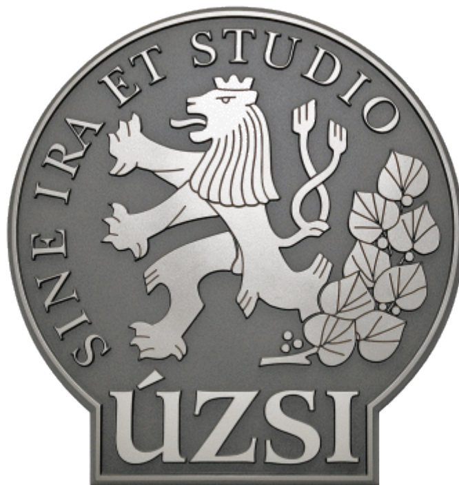
Obr. 3. Znak Úřadu pro zahraniční styky a informace[23]

Úřad pro zahraniční styky a informace je druhou ze tří zpravodajských služeb. Pracuje s informacemi, které se týkají dění ve světě a které by mohlo ohrozit bezpečnost a zájmy České republiky.