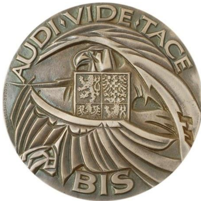
Obr. 2. Znak Bezpečnostní informační služby[22]

Bezpečnostní informační služba je první ze tří zpravodajských služeb ČR, která působí uvnitř státu a jejím úkolem je získávání, shromažďování a vyhodnocování informací o terorismu, hrozbách bezpečnosti, činnosti zahraničních zpravodajských služeb na území ČR nebo ohrožení utajovaných informací.[11]