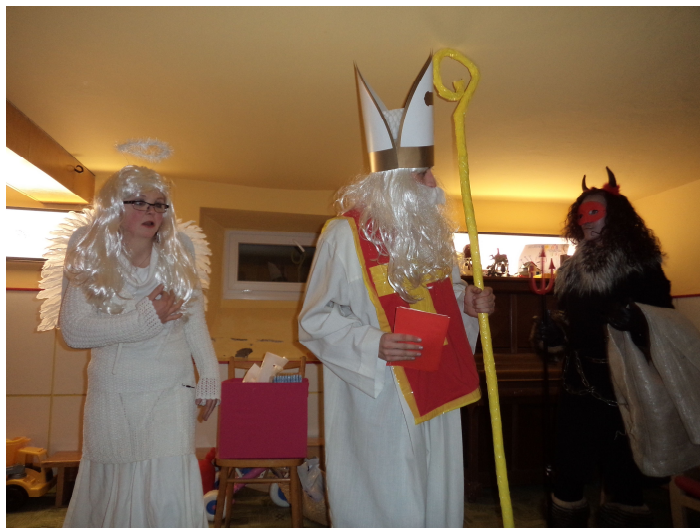
Mikulášský program