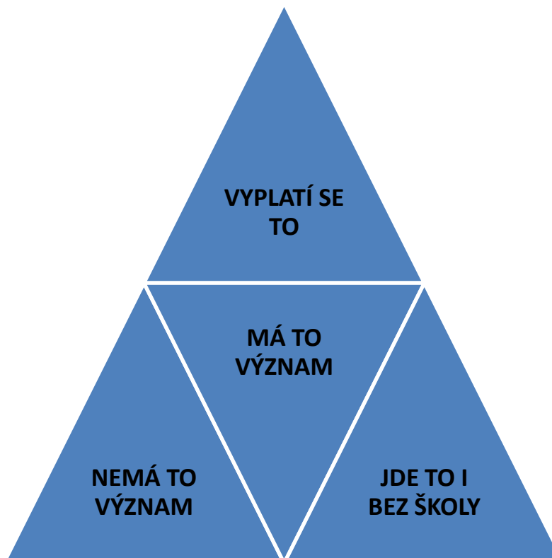
Obrázek 2 - Zobrazující vzájemně propojené postoje ke vzdělávání.

Na základě naší hlavní výzkumné otázky byla vytvořena výše uvedená dílčí výzkumná otázka, na kterou respondenti odpověděli a umožnili nám získat hlubší vhled do problematiky vzdělávání bezdomovců. Pro lepší orientaci v problematice jsme sestavili následující schéma.