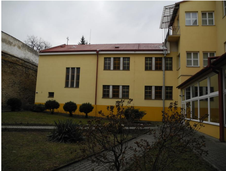
Obr. 3 Nemocnice Milosrdných sester sv. Vincence de Paul