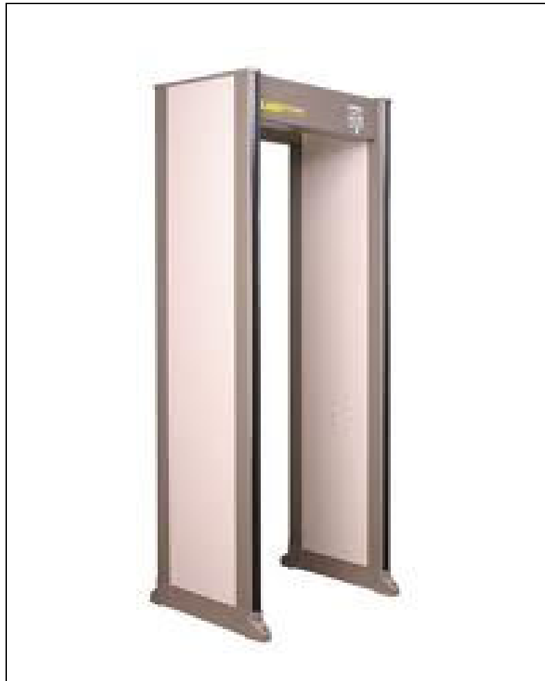
Obr. 3. kontrolní rám

Vlastní kontrola vstupu probíhá za použití kontrolního rámu na odhalení kovových předmětů u procházející osoby. Rám indikuje i výšku ve které se případně kovový předmět nalézá.