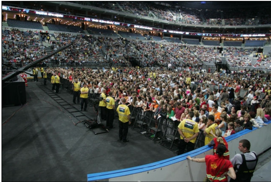
Obr. 1. vyobrazení nášlapu

do určité míry distanci mezi aktérem a diváky, tudíž omezuje možnost napadení aktéra (zpěváka) divákem. Zároveň omezuje možnost nežádoucí exhibici diváka na pódiu.