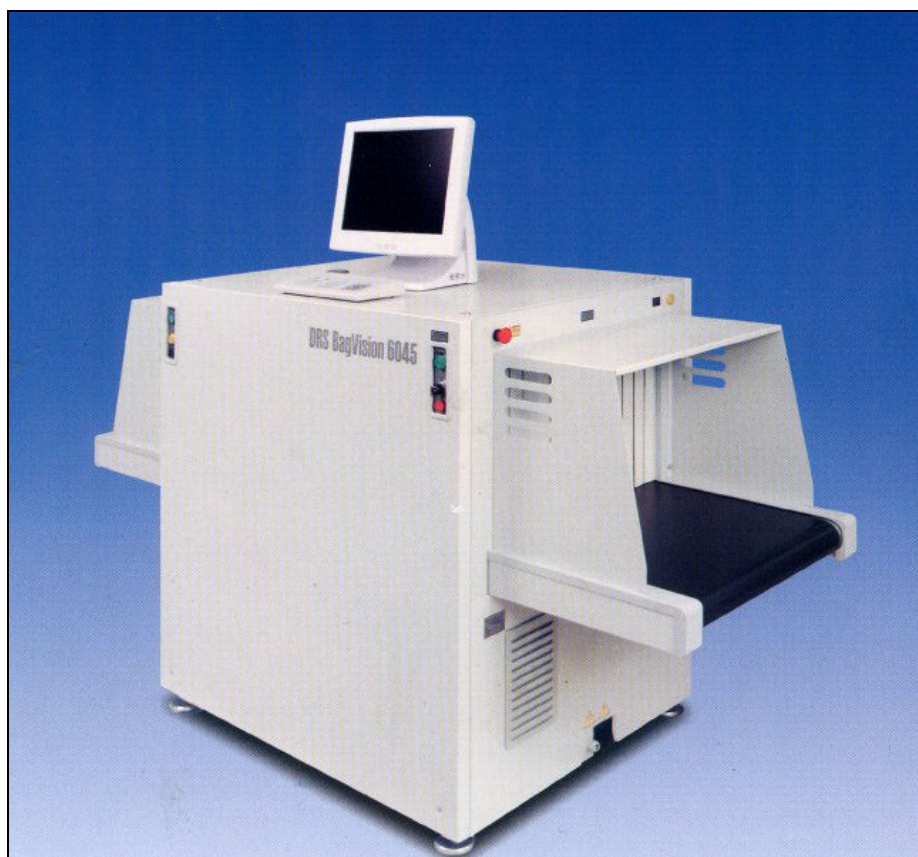
Obr. 4. přístroj pro kontrolu zavazadel

Ostatní zavazadla jsou umístěna na posuvný pás RTG zařízení a jsou kontrolována na displeji monitoru se zaměřením na odhalení zbraní, či ostatních předmětů, které by jako zbraň mohly být použity.