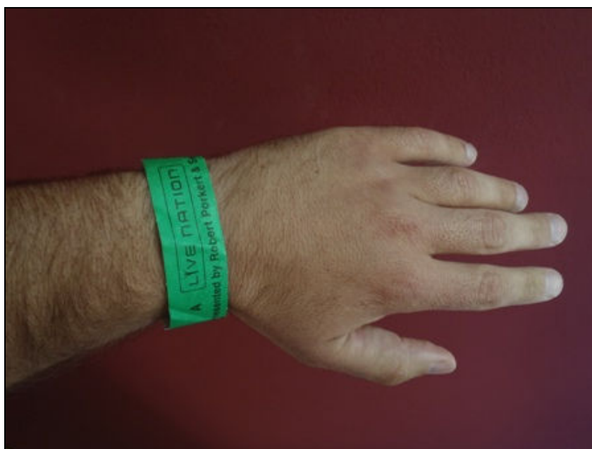
Obr. 6 ukázka STRIP pásky

Zároveň jej pracovníci SBS označí STIRIPEM (páskou na ruku), který po sundání nelze podruhé použít. STRIPY jsou různé pro různé zóny. Zajišťují označeným divákům např. oprávnění vstupu do VIP zóny, kde je možné případná konzumace připraveného občerstvení.