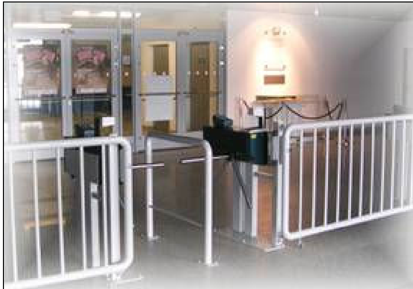
Obr. 5 automatická kontrola vstupenek

Dále se divák posouvá do prostoru s automatickou kontrolou vstupenky, která zamezuje její dvojití použití. Tímto se divák autorizuje a je mu umožněn vstup do prostor arény.