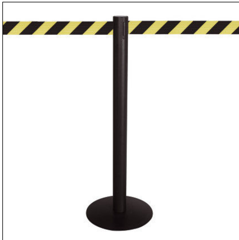
Obr. 2. páskové zábrany

Před otevřením vstupních portálů je důležité rozmístit mobilní prostředky k usměrňování davu lidí.