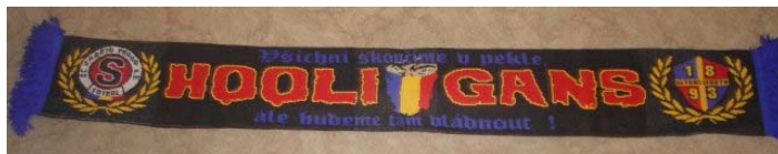
Šály patří mezi klasické symboly