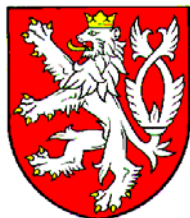
Český lev, výraz nacionalismu nesouhlas s neonacismem