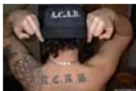
Vytetované nebo nošené symboly odporu proti policii: „A.C.A.B.“