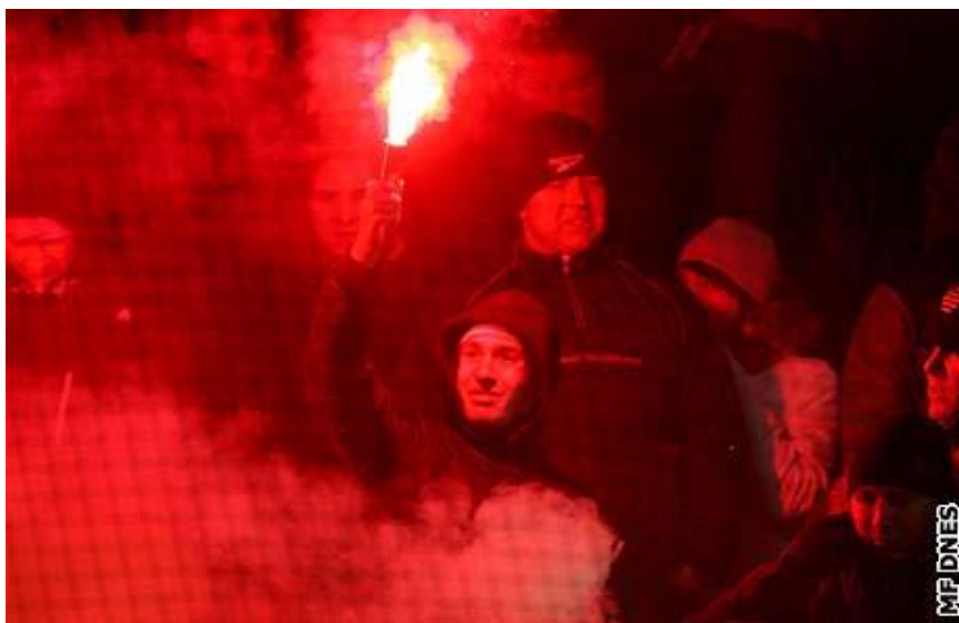
Detailní foto fanouška Spartaku Moskva se zapálenou světlicí během utkání Sparta Praha - Spartak Moskva