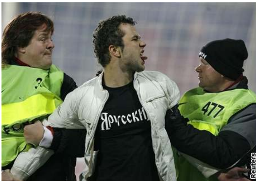
Pořadatelé odvádějí fanouška Spartaku Moskva, který vběhl na trávník