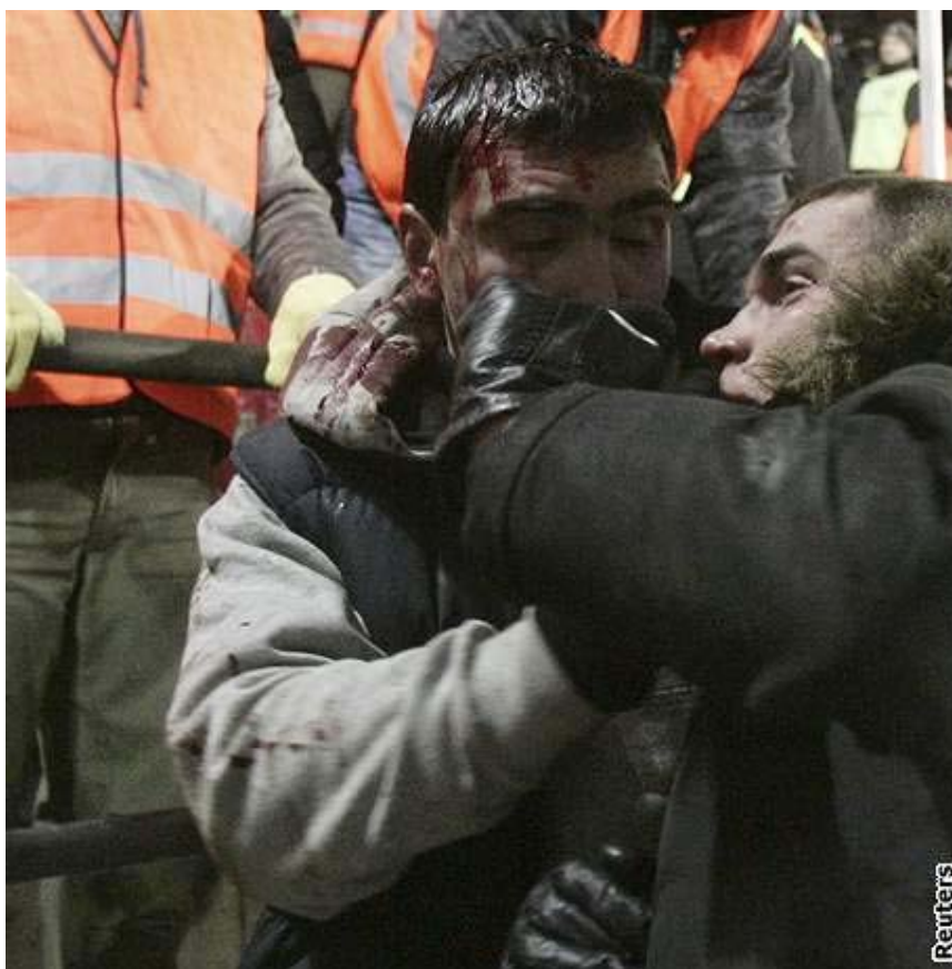
Agrese a násilí mezi fanoušky Spartaku Moskva během utkání Sparta Praha - Spartak Moskva