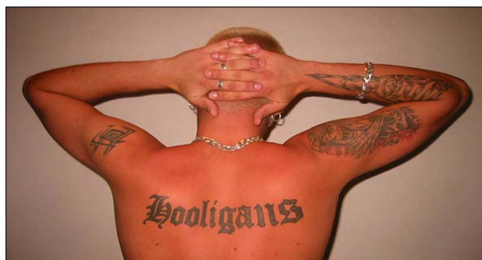
Foto - Tetování hooligans