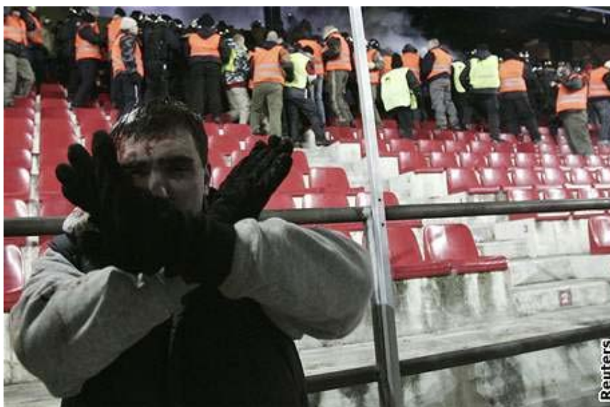
Fanoušek Spartaku Moskva po útoku dalšího fanouška téhož mužstva během utkání Sparta Praha - Spartak Moskva