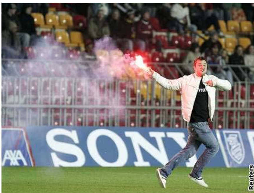
Fanoušek Spartaku Moskva, který narušil průběh utkání s pražskou Spartou