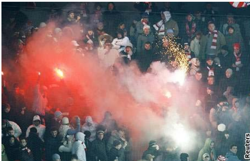
Fanoušci Spartaku Moskva používající pyrotechniku během utkání Sparta Praha - Spartak Moskva