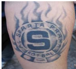
Tetování v klubových „barvách“ nebo se symboly klubu