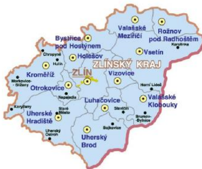
Obr. 1. Mapa správních obvodů Zlínského kraje. [13]

Zlínský kraj vznikl k 1. lednu 2000 v rámci reformy veřejné správy jako jeden ze 14 nových krajů České republiky podle ústavního zákona č. 347/1997 Sb., o vytvoření vyšších územních samosprávných celků. Vznikl sloučením okresů Zlín, Kroměříž a Uherské Hradiště, které patřily k Jihomoravskému kraji, a okresu Vsetín, který spadl do Severomoravského kraje. Spolu s Olomouckým krajem tvoří region soudržnosti Střední Morava. S účinností od 1. 1. 2003 se vytvořilo 13 správních obvodů obcí s rozšířenou působností (obce III. stupně), v jejichž rámci působí 25 územních obvodů pověřených obcí (obce II. stupně) (Obr. 1.). [12] Na území Zlínského kraje existuje 24 mikroregionů, které vznikají za účelem dobrovolné i nezbytné spolupráce obcí, která je dána spádovostí, historickými i současnými vazbami a společně řešenými problémy.