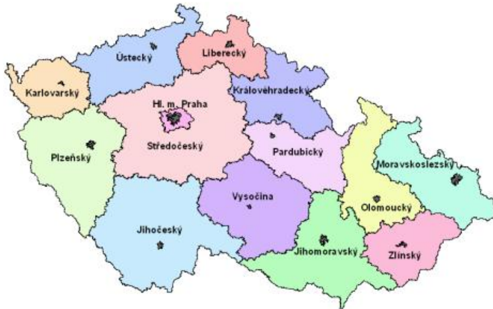
Obr. 2. Mapa krajů České republiky. [14]

149 ob./km 2 výrazně převyšuje republikový průměr. Nejvyšší zalidněnost je v okrese Zlín (187 ob./km 2 ) a nejnižší v okrese Vsetín (128 ob./km 2 ). [12]