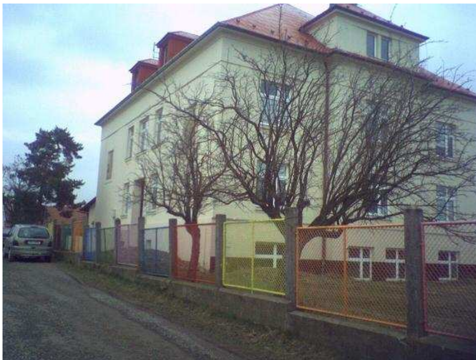
Obrázek 10 Budova DD a ŠJ Plumlov, Balkán 333 (2009)