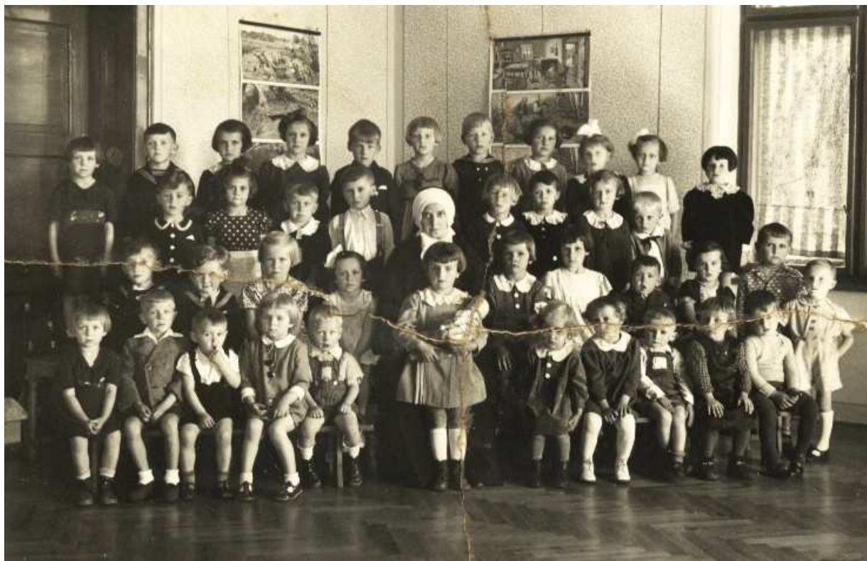
Obrázek 8 Školka sirotčince Sv. Josefa