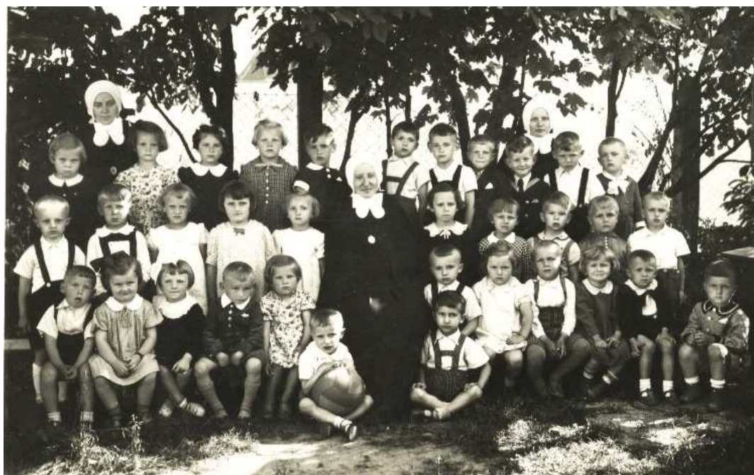
Obrázek 3 Školka v sirotčinci