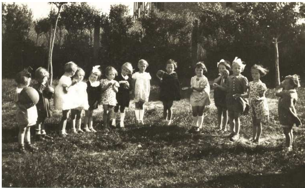
Obrázek 7 Školka v sirotčinci Sv. Josefa na zahradě