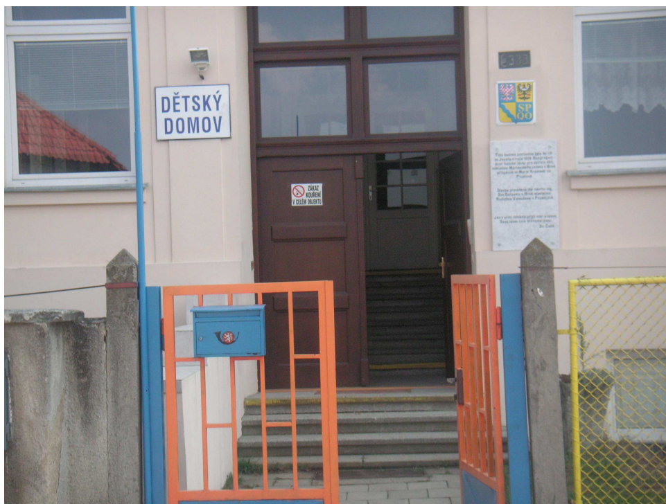
Obrázek 13 Vstupte! (2009)