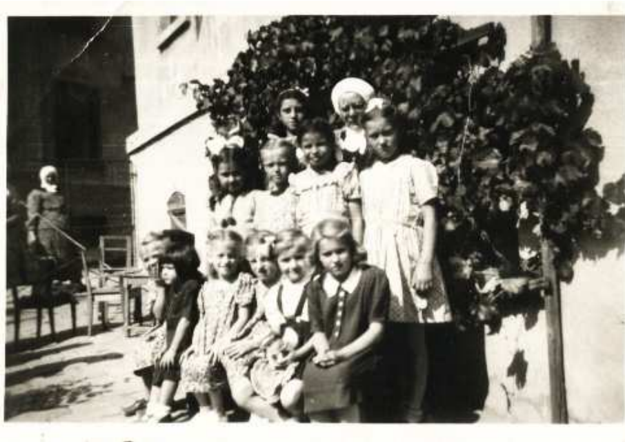
Obrázek 5 Děti ze sirotčince s řádovou sestrou