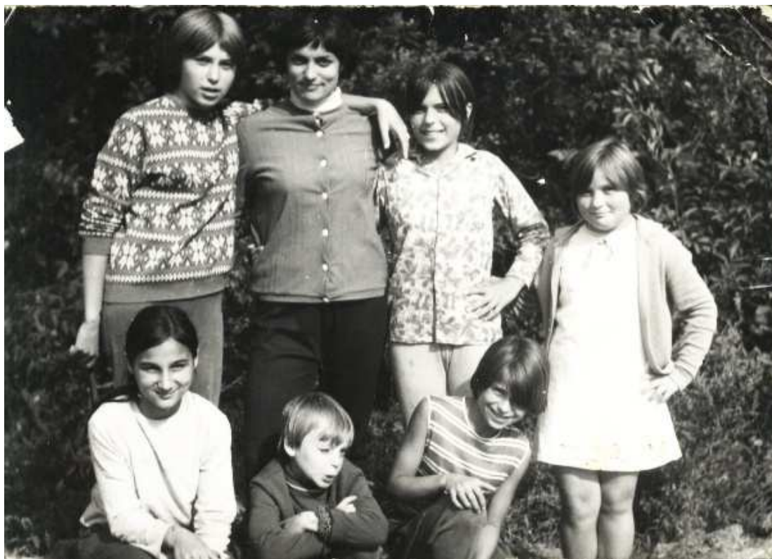
Obrázek 6 Foto s dětmi z dětského domova