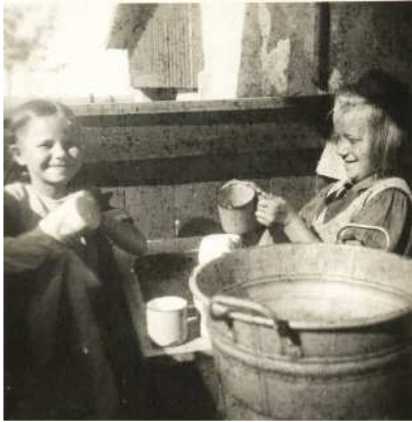
Obrázek 4 Sirotčinec Sv. Josefa v Plumlově