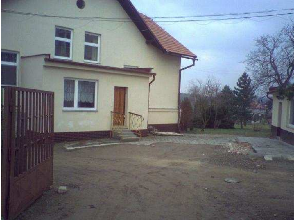
Obrázek 14 Menší budova tzv „domeček“ (2009)