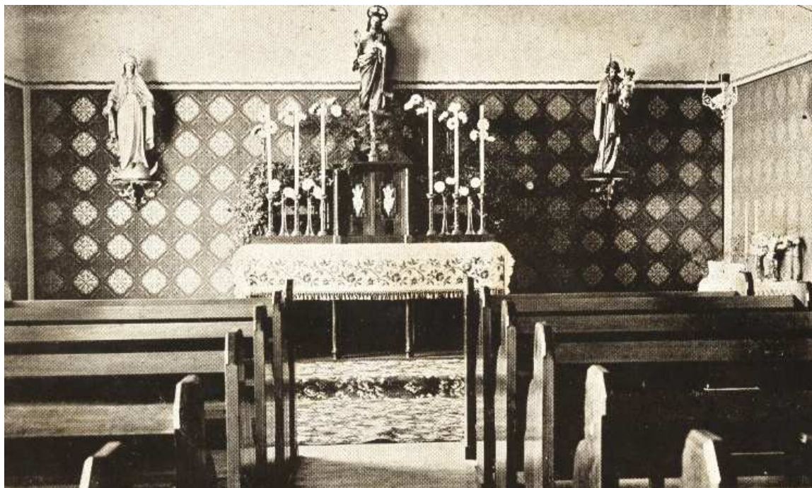
Obrázek 9 Kaple ve 2. patře sirotčince před r.1948 (dnes jsou zde pokoje pro děti)