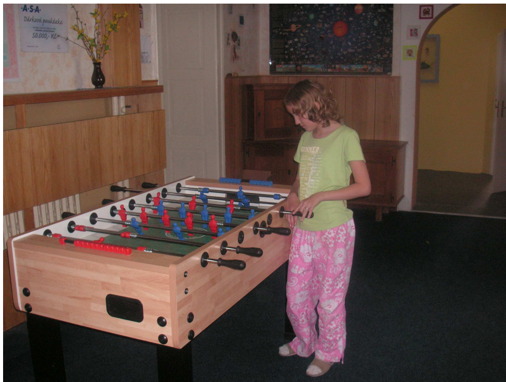
Obrázek 12 Vstupní hala dnešního DD ŠJ je vybavena fotbálkem. (2009)