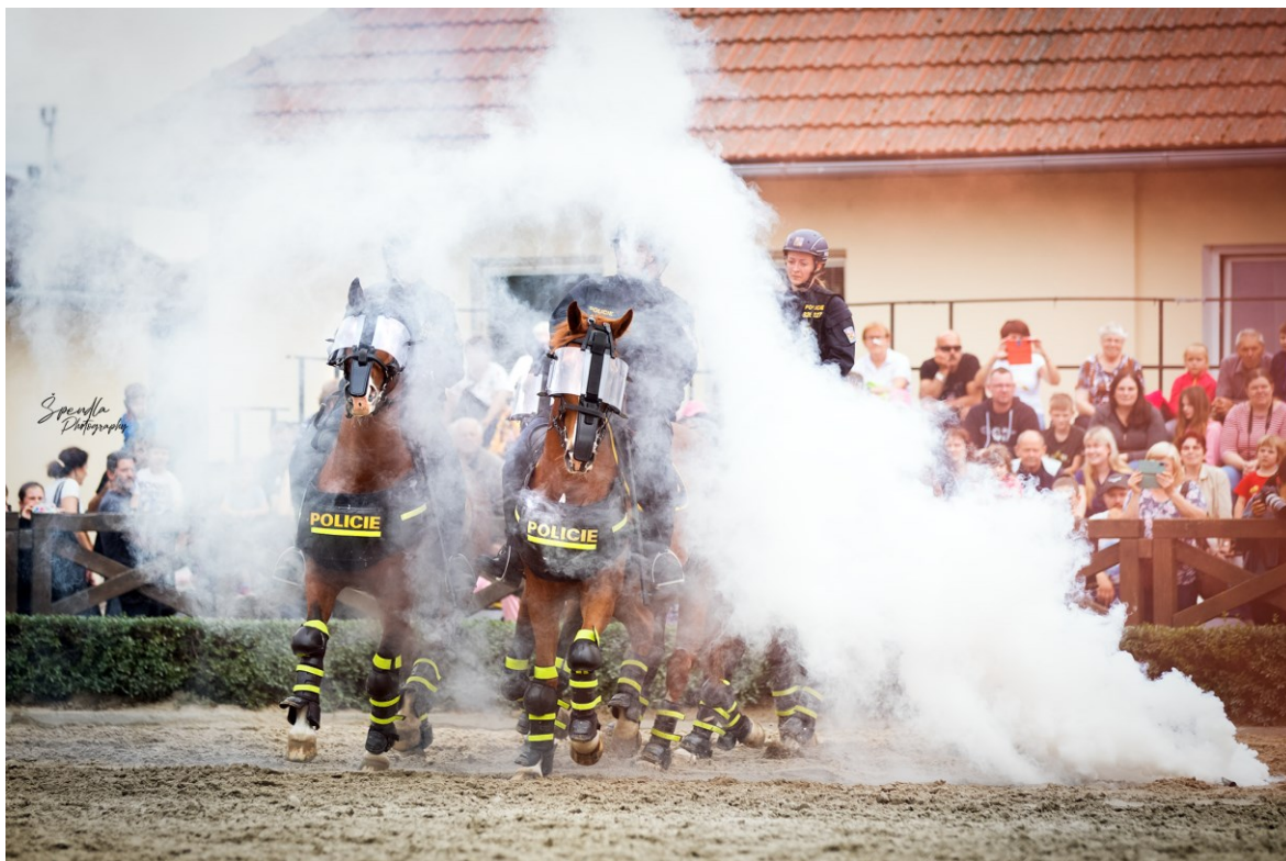
Obrázek 6 – Oddělení služební hipologie Zlín

Nácvik zákroku pod jednotným velením je typem cvičení, ke kterému dochází minimálně jednou za rok a cvičí se společně s pořádkovou jednotkou. Ve cvičení jsou zapojeni těžkoodění pěší policisté ze speciální pořádkové jednotky i policisté z oddělení služební kynologie. (Konířová, 2018)