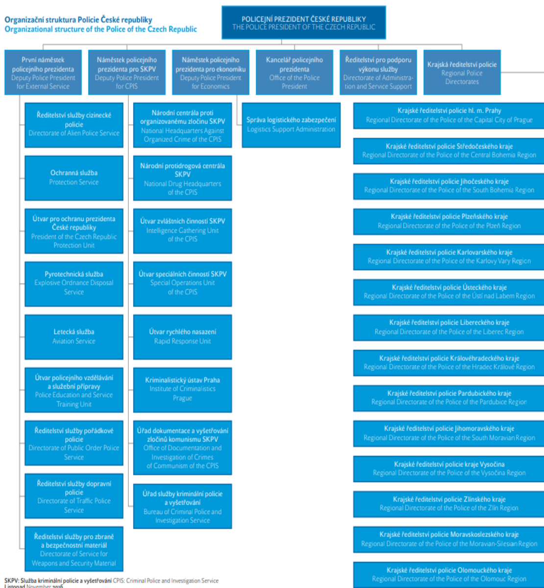
Obrázek 3 – Organizační struktura Policie České republiky (Policie ČR, 2017)

policie a útvary zřízenými v rámci krajských ředitelství. Aktuální stav policie činí v útvarech s celorepublikovou působností 4 191 policistů a v krajských ředitelstvích policie 34 319 policistů. (Policie ČR, 2023)