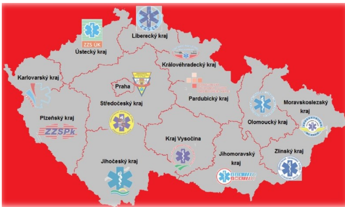
Obrázek 2 – Systém zdravotnické záchranné služby ČR (Zachrannaslužba, 2002)

ZZS je zřízena zákonem č.374/2011 Sb., o zdravotnické záchranné službě.