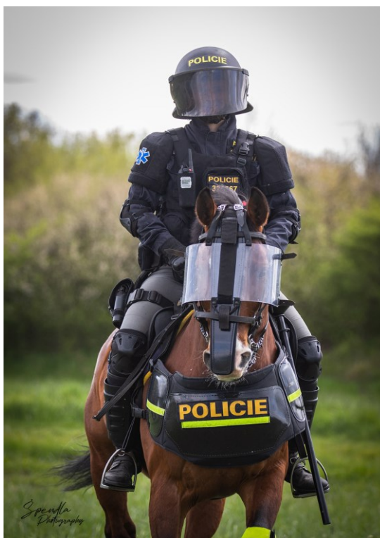
Obrázek 7 – Oddělení služební hipologie Zlín (Monika Špendlíková, 2023)