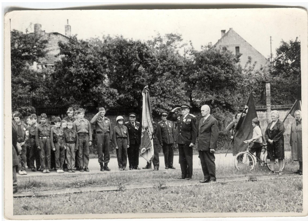
Obrázek 12 Oslava 70. výročí založení sboru roku 1974