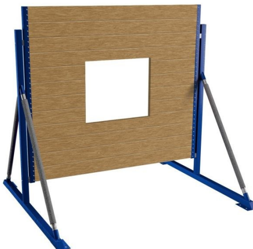
Obrázek 7 Bariéra 200 cm s oknem

Tato překážka je vhodná pro trénink a závody v disciplínách; dvojboj a štafeta 4x 100 metrů s překážkami. Skládá se z kovové konstrukce a dřevěné výplně 2 x 2 m, ve které se nachází okno o velikosti 0,6 x 0,6 m. Tato překážka vyhovuje bezpečnostním požadavkům a kvalitám podle SH ČMS. Je opatřena ochrannými a bezpečnostními prvky na rozpěrách noh bariéry. Bariéra je také pro snadnější manipulaci rozložitelná a lze ji opatřit hroty pro pevné ukotvení k podkladu. Cena této bariéry na webu vyzbrojna.cz je 18.150,- Kč s DPH.