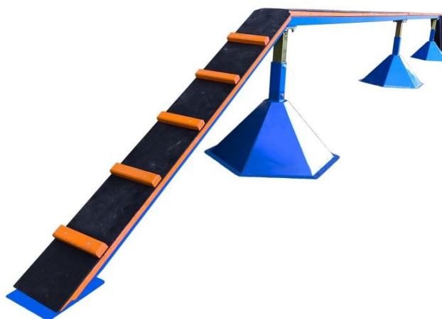
Obrázek 8 Kladina 8 metrů

Tato překážka je vhodná pro trénink a závody kategorie dorostu, mužů a žen v disciplínách; běh na 100 metrů s překážkami a štafeta 4x 100 metrů s překážkami. Kladina měří 8 m a široká je 0,18 m. Překážka je opatřena stavitelnými nohami na výšku 80 cm pro závody a trénink žen a dorostu, nebo 120 cm pro závody a trénink mužů a dorostu. Náběhové můstky jsou 2 m dlouhé a 0,25 m široké a jsou opatřeny bezpečnostními příčnými laťkami. Povrch kladiny a náběhových můstků je opatřen protiskluzovým tartanem, po kterém lze pohodlně běhat i s tretrami. Cena této kladiny na webu vyzbrojna.cz je 41.291, - Kč.