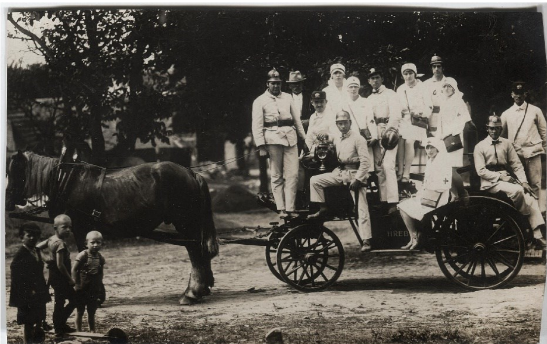
Obrázek 10 První ruční stříkačka obce Hřebeč, fotografie z roku 1933