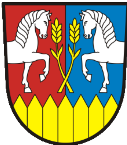
Obrázek 3 Znak obce Hřebeč

Obec Hřebeč se nachází ve Středočeském kraji v okrese Kladno, asi 3 km od Kladna a 20 km od Prahy. Obec má rozlohu 422 hektarů a žije v ní 2 151 obyvatel. Hřebčí protéká Lidický potok, zvaný též Hřebečský. (Současnost, 2024)