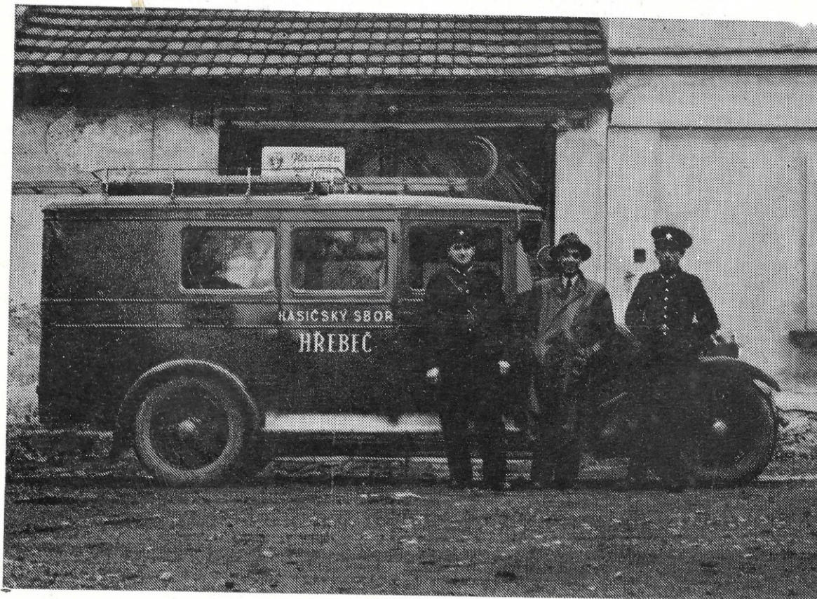
Obrázek 11 Požární vůz v roce 1945