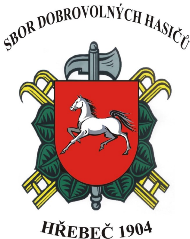
Obrázek 5 Znak SDH Hřebeč