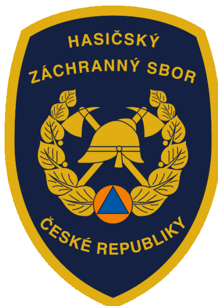
Obrázek 1 Znak HZS ČR

Hasičský záchranný sbor ČR je koordinátorem a hlavním pilířem integrovaného záchranného systému. V praxi to mimo jiné znamená, že při zásahu více jednotek IZS, zpravidla na místě velí příslušník HZS ČR, který zodpovídá za řízení spolupráce mezi složkami a koordinaci záchranných a likvidačních prací. Operační a informační středisko IZS (což v ČR je operační a informační středisko HZS) shromažďuje a rozmisťuje potřebné síly a prostředky jednotlivých složek IZS v konkrétních lokalitách. Na strategické úrovni je IZS koordinován krajským útvarem krizového řízení a Ministerstvem vnitra. (HZS ČR, 2009)