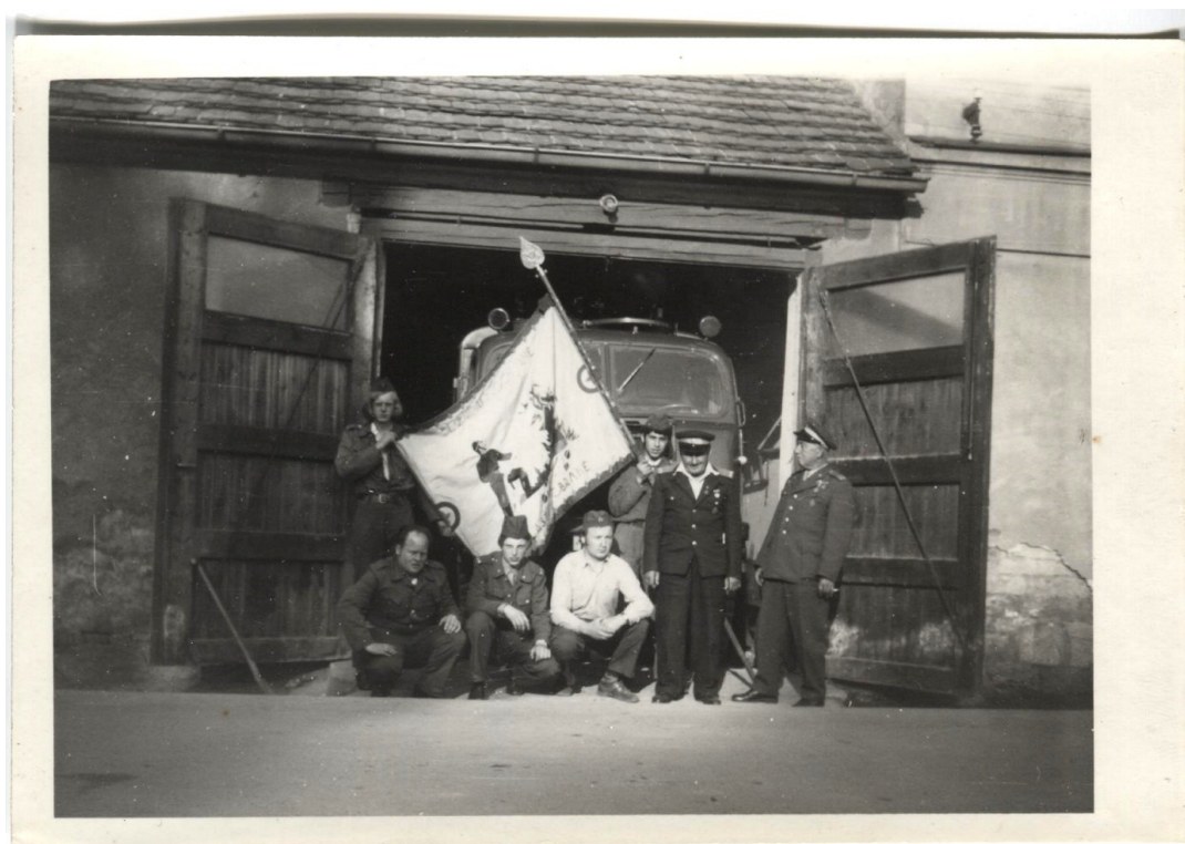
Obrázek 14 Původní hasičská zbrojnice