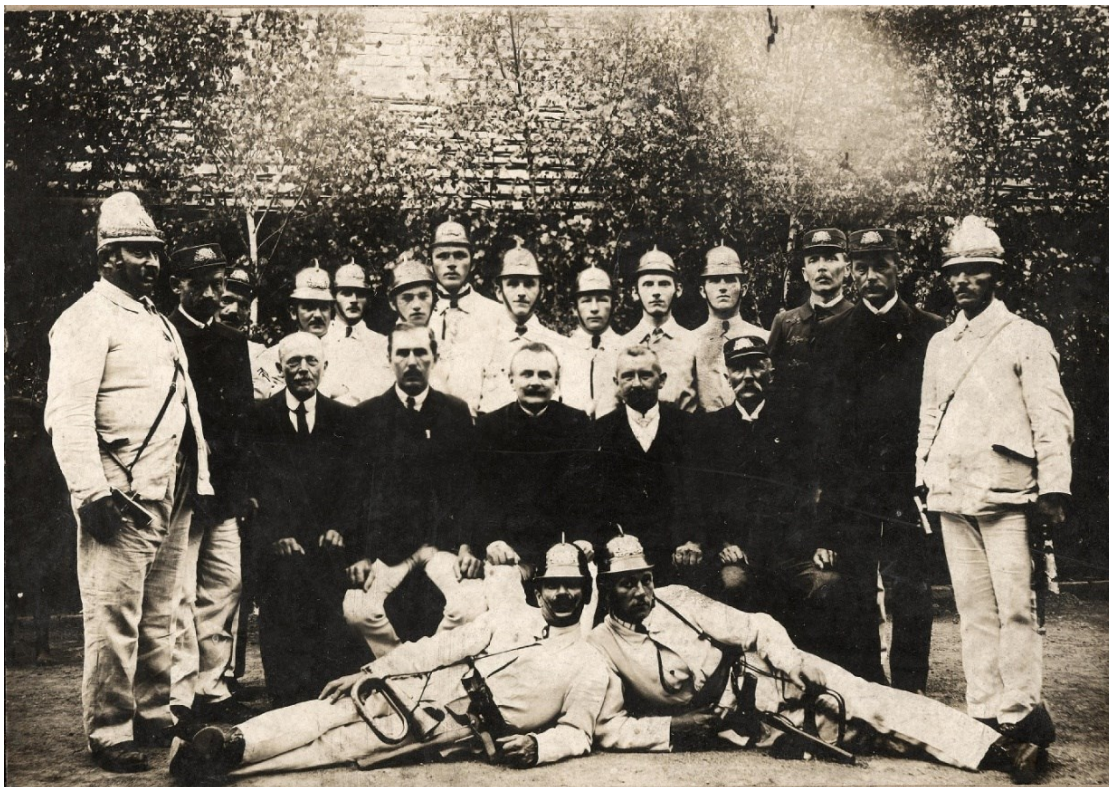
Obrázek 9 První fotografie členů SDH Hřebeč z roku 1904