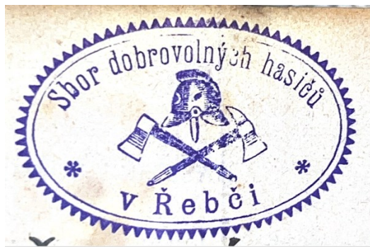
Obrázek 4 Razítko SDH Hřebeč z roku 1904 (zdroj: vlastní)

Od 11. do 18. století se majitelé tehdejší osady velmi rychle střídali. Teprve v 19. století se Hřebeč stala soukromým majetkem Habsbursko-Lotrinské dynastie a v roce 1847 se stala součástí soukromého vlastnictví rakouského panovníka. Po smrti svého strýce v roce 1875 obec zdědil samotný František Josef I. Posledním soukromým vlastníkem byl až do roku 1918 jeho nástupce Karel I. Habsbursko-Lotrinský. (Historie, 2023)