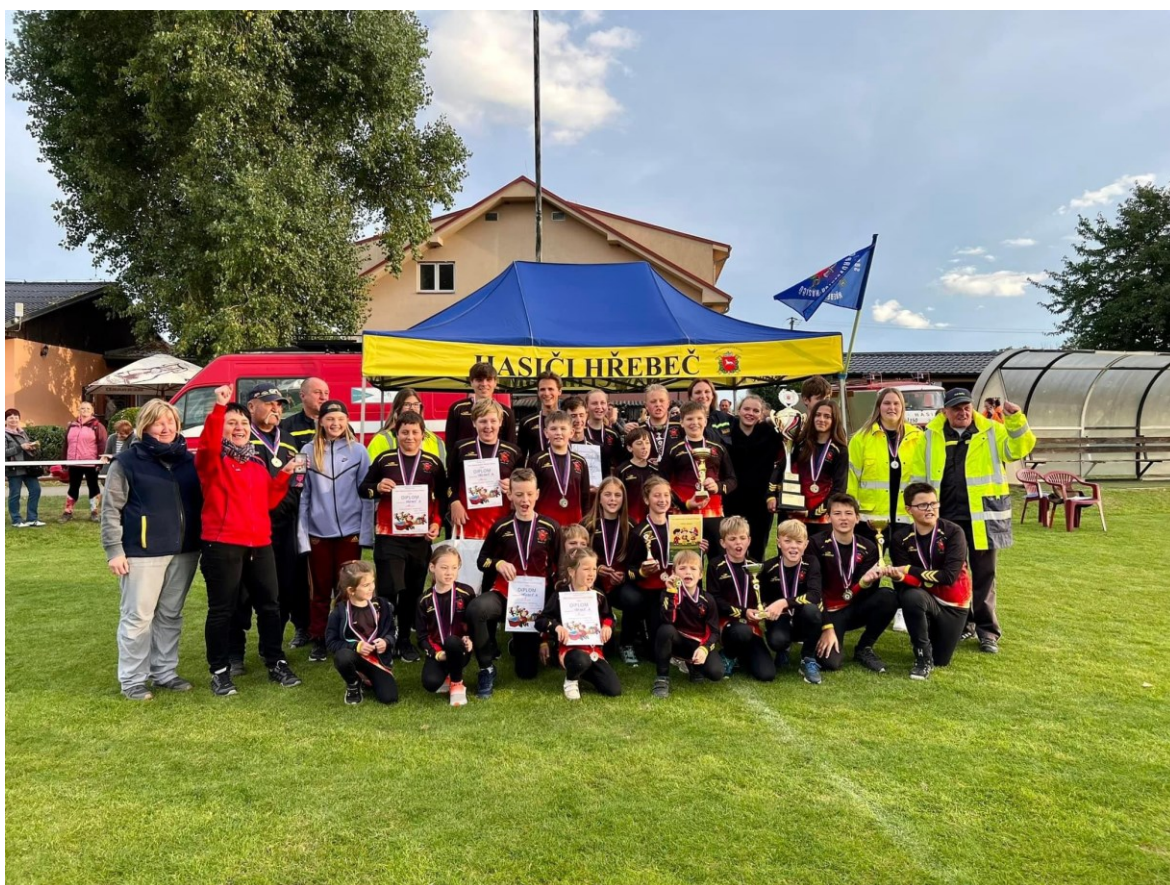
Obrázek 18 Kolektiv mládeže SDH Hřebeč