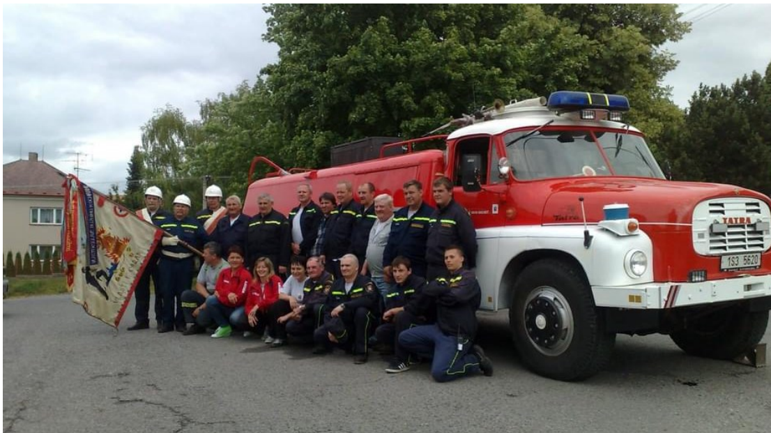
Obrázek 15 Oslava 110. výročí založení sboru v roce 2014, Tatra 148