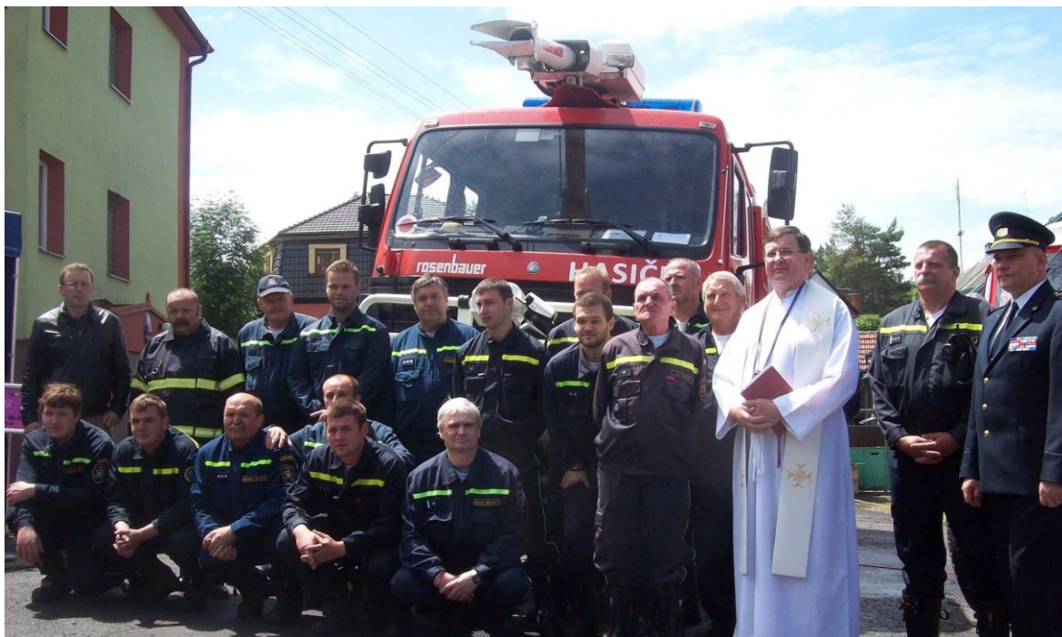
Obrázek 17 JSDH Hřebeč s hosty a novým vozem Mercedes Benz Actors