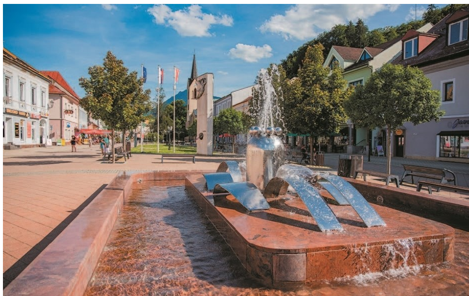
Obrázok 1 – Dolný Kubín, Hviezdoslavovo námestie. (Joma Travel, 2023)

Mesto sa začalo významne meniť po roku 1683, kde sa konali stoličné generálne a partikulárne zasadania a keď sa definitívne rozhodlo, že bude sídlom stolice. Po požiari v roku 1834 sa začala postupná prestavba celého Dolného Kubína. Nové rozdelenie stavebných pozemkov umožnilo výstavbu domov mestského charakteru a rovné usporiadanie námestia. Dolný Kubín sa postupne premenil na mestské sídlo. (Mesto Dolný Kubín, 2012)