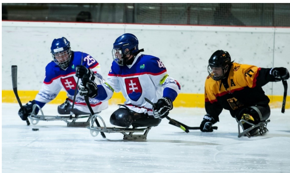
Obrázok 2 – Medzinárodný parahokejový turnaj Slovakia Cup. (Dráb, 2019b)

Medzinárodný para hokejový turnaj troch krajín: Slovenska, Českej republiky a Nemecka, ktorý je vedený pod názvom Slovakia Cup sa uskutočnil počas troch dní, od 26. do 28. marca 2019. Pre zimný štadión a pre mesto Dolný Kubín to bola jedna z najvýznamnejších akcií ,konajúcich sa za posledné roky v tomto meste. Prvý zápas, ktorý sa konal v utorok 26. marca začínal o štvrtej hodine poobede a vstup bol povolený už hodinu pred jeho začiatkom. Pred začiatkom konania akcie boli už na mieste prítomné záchranné zložky, ktoré dohliadali na situáciu ako vo vnútornej tak vo vonkajšej časti štadióna. Pred nástupom do areálu boli prítomné poverené osoby, ktoré kontrolovali vstupenky a zaisťovali bezpečnosť. Vo vnútorných priestoroch sa nachádzal bufet s občerstvením pre účastníkov a taktiež stánky s reklamným materiálom, ktoré si mohli fanúšikovia zakúpiť a podporiť tým svoj hokejový klub. Pred vstupom do hľadiska sa nachádzali členovia bezpečnostnej služby, ktoré poskytovali potrebné informácie pre divákov. Rovnako to fungovalo aj nasledujúce dva dni.