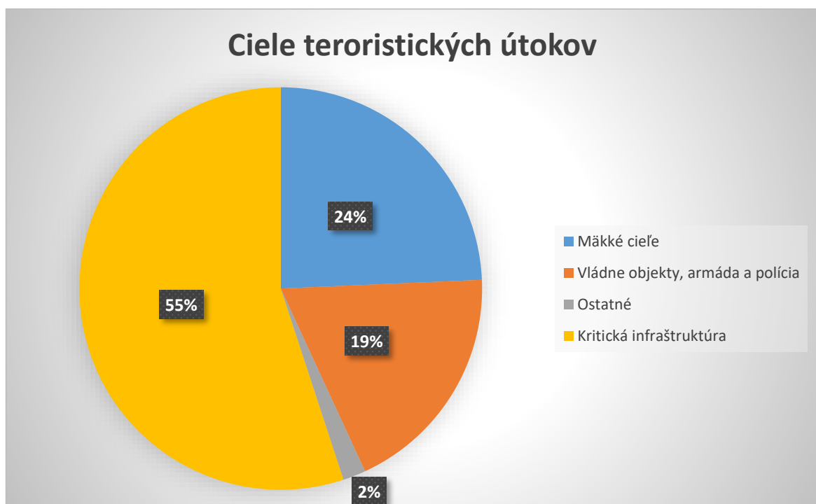
Graf 1 – Ciele teroristických útokov. (Kalvach, 2016)

Nasledujúce grafy prezentujú ich ciele a metódy útoku: