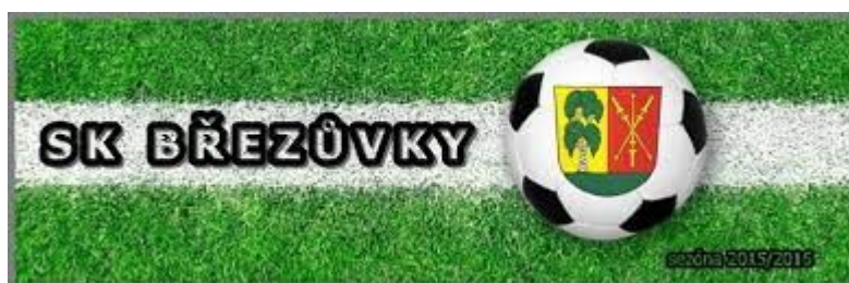
Obrázek 1 logo klubu SK Březůvky

V rámci praktické části diplomové práce bude nejprve popsáno zázemí a prostředí klubu SK Březůvky. Pro podmínky tohoto prostředí bude následně za účelem identifikace možných slabých stránek a rizik vypracována SWOT analýza. Pro dotvoření uceleného obrazu o zkoumané problematice bude navíc realizováno krátké dotazníkové šetření mezi návštěvníky fotbalového stadionu vyšší a nižší třídy, za účelem porovnání subjektivního pocitu bezpečnosti těchto návštěvníků na jednotlivých typech stadionů.