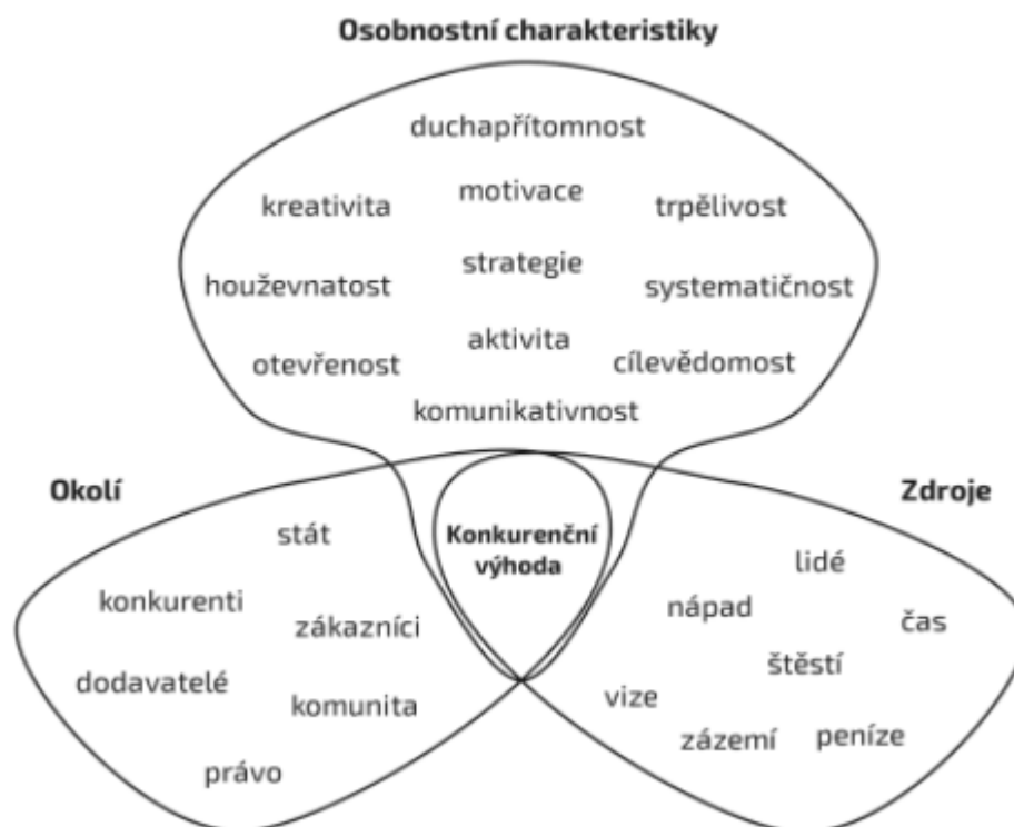
Předpoklady podnikání [ŠAFROVÁ, 2019] 1

Na podnikání je skvělé, že si člověk může vybrat obor, který je mu skutečně blízký, přijít s něčím velmi inovativním a užitečným, a tak vyřešit nějaký problém. Pokud si ale podnikatel myslí, že když Vás baví pečení cukroví, je nejlepší životní cestou otevřít si cukrárnu, jde bohužel o omyl a následně o docela častý zdroj nespokojenosti. Samotná produkční činnost podniku totiž zabere podnikatelům jen zlomek celkového času. Zbytek bude muset věnovat jednání s dodavateli, zákazníky, administrací, řešení konfliktů a problémů, organizací času a logistiky a spoustě dalších aktivit. Podnikání je proto skvělé hlavně pro lidi, které baví právě organizování každodenního provozu a hledání neotřelých řešení problémů.