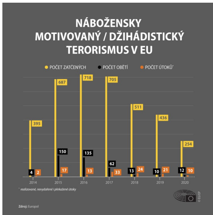
Obrázek 1 – Počet nábožensky motivovaných teroristických útoků v EU (Evropský parlament, 2020)