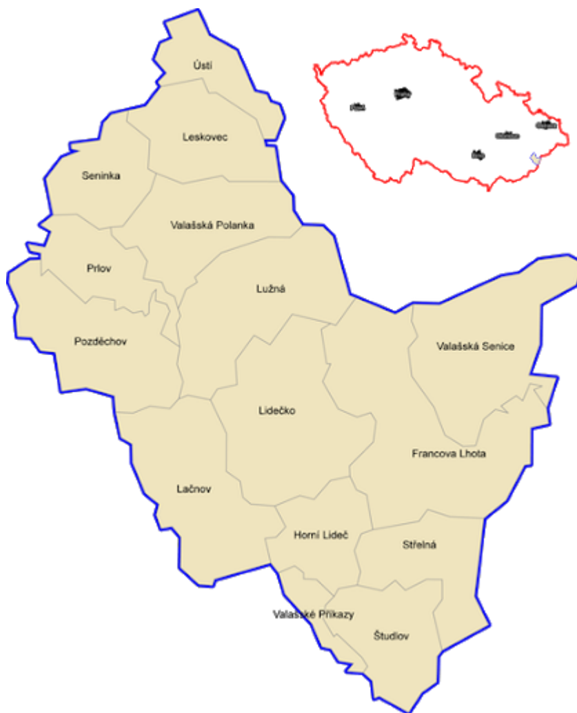
Obr. 2 Mapa MAS Hornolidečsko (© 2021. MAS Hornolidečsko)

Největšími zásady v regionu jsou příroda, kulturní tradice, památky a lidský potenciál. Území MAS Hornolidečsko je podhorská a zemědělská oblast, což se odráží v místní ekonomické struktuře. Největší zdroj pracovních příležitostí pro místní obyvatele jsou malé a střední podnikatelé (do 10 až 50 zaměstnanců). V sektoru služeb je to cestovní ruch (ubytování a pohostinství), služby pro obyvatele (kadeřnictví, opravy automobilů, veřejná správa), ve výrobní oblasti jsou to tradiční řemesla (zámečníci, zpracování dřeva atd.) a zemědělství. Důležitým faktorem je zde také výroba potravin, zejména produkce tradičních masných výrobků a výroba ekologických produktů. Zemědělství má nezastupitelný význam na území Hornolidečska, zejména z hlediska údržby krajiny. Lesnictví, chov skotu a ovcí jsou pro území MAS také velmi důležité.