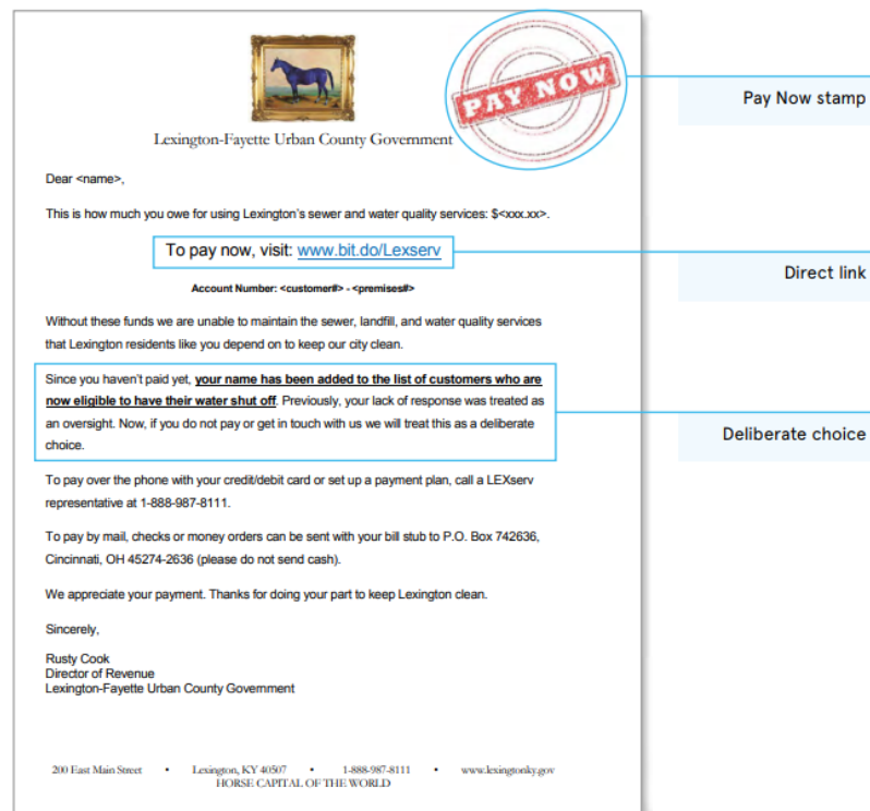
Obr. 2 Vzor obsahu dopisu s jednotlivými úpravami (The Behavioral Insight Team, 2016)