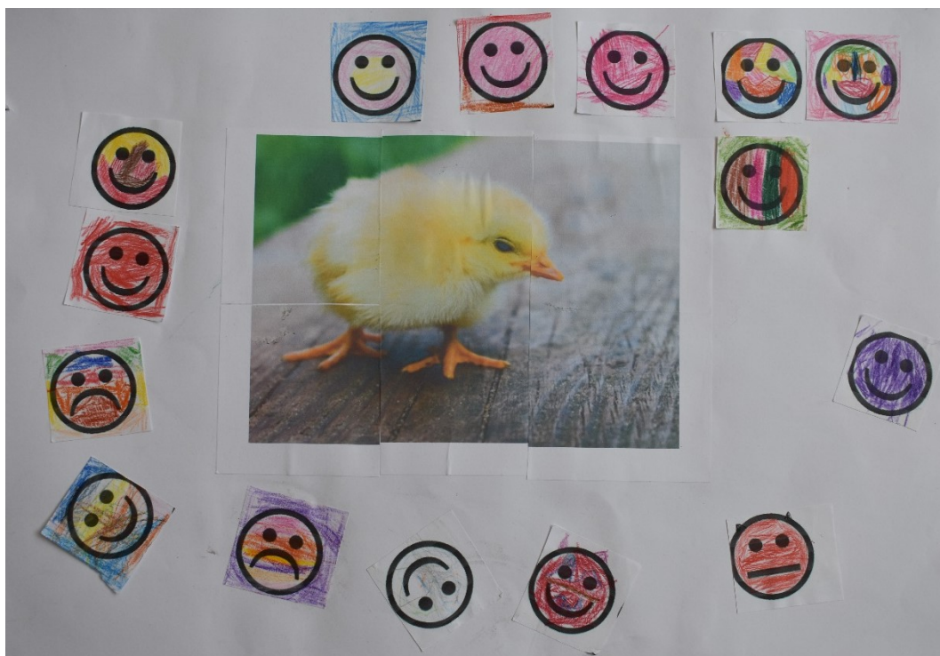
Obrázek 14 Hodnocení dětmi – Aktivita 6