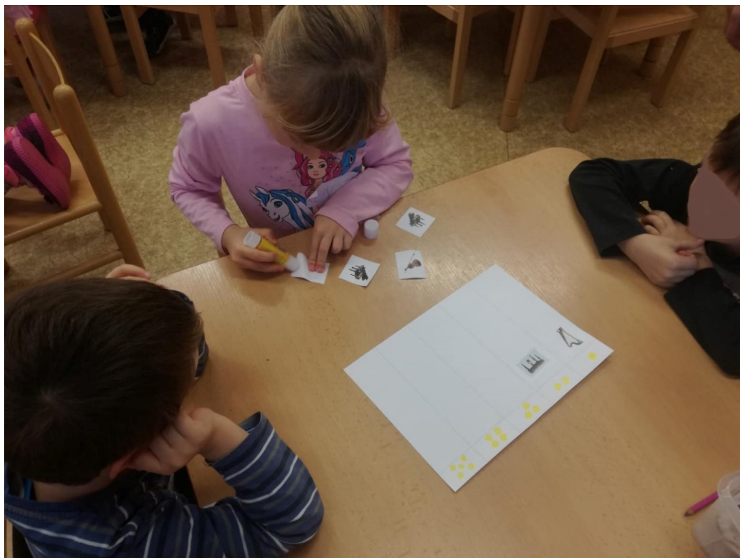
Obrázek 3 – Aktivita 2