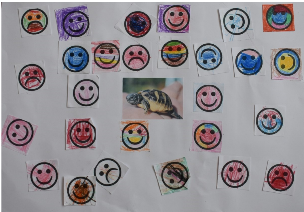
Obrázek 17 Hodnocení dětmi – Aktivita 7 a 8