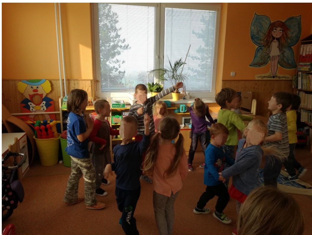
Obrázek 16 – Aktivita 8