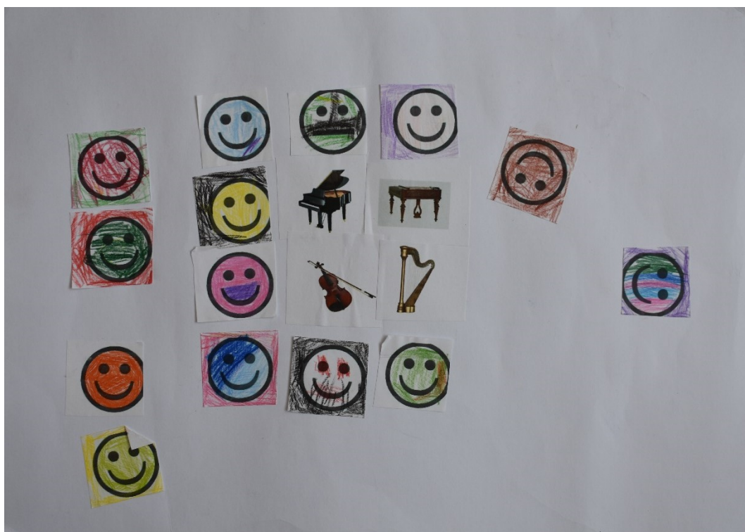
Obrázek 4 Hodnocení dětmi – Aktivita 2