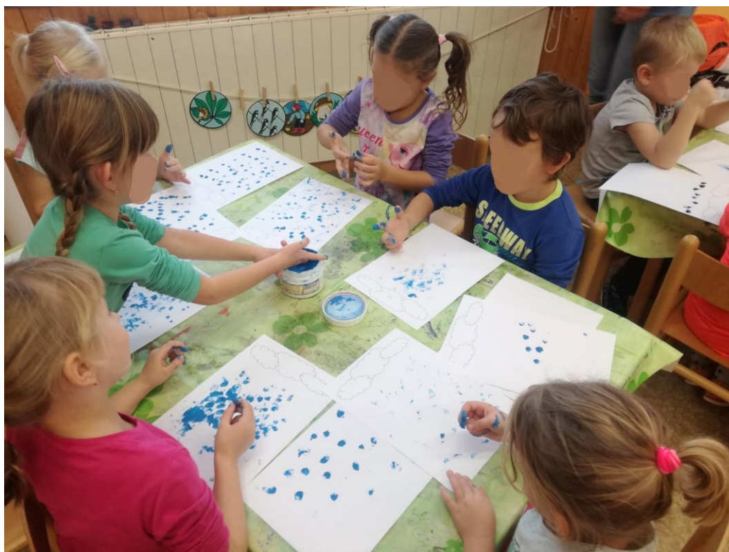
Obrázek 6 – Aktivita 3