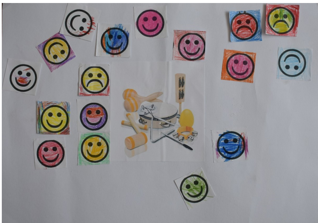
Obrázek 2 Hodnocení dětmi – Aktivita 1