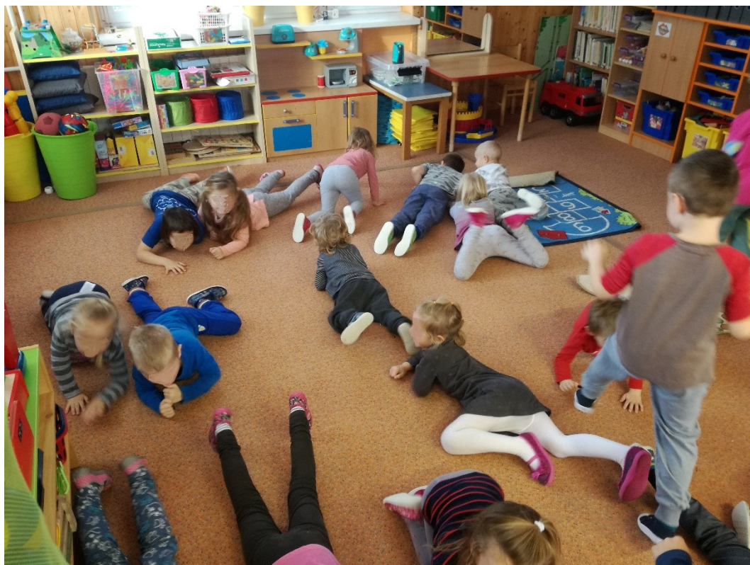
Obrázek 15 – Aktivita 7