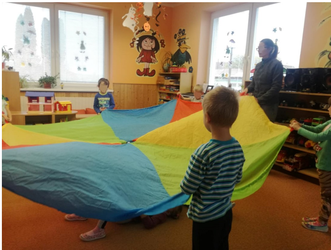
Obrázek 5 – Aktivita 3