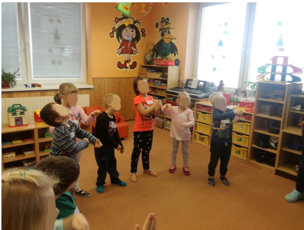
Obrázek 1 – Aktivita 1