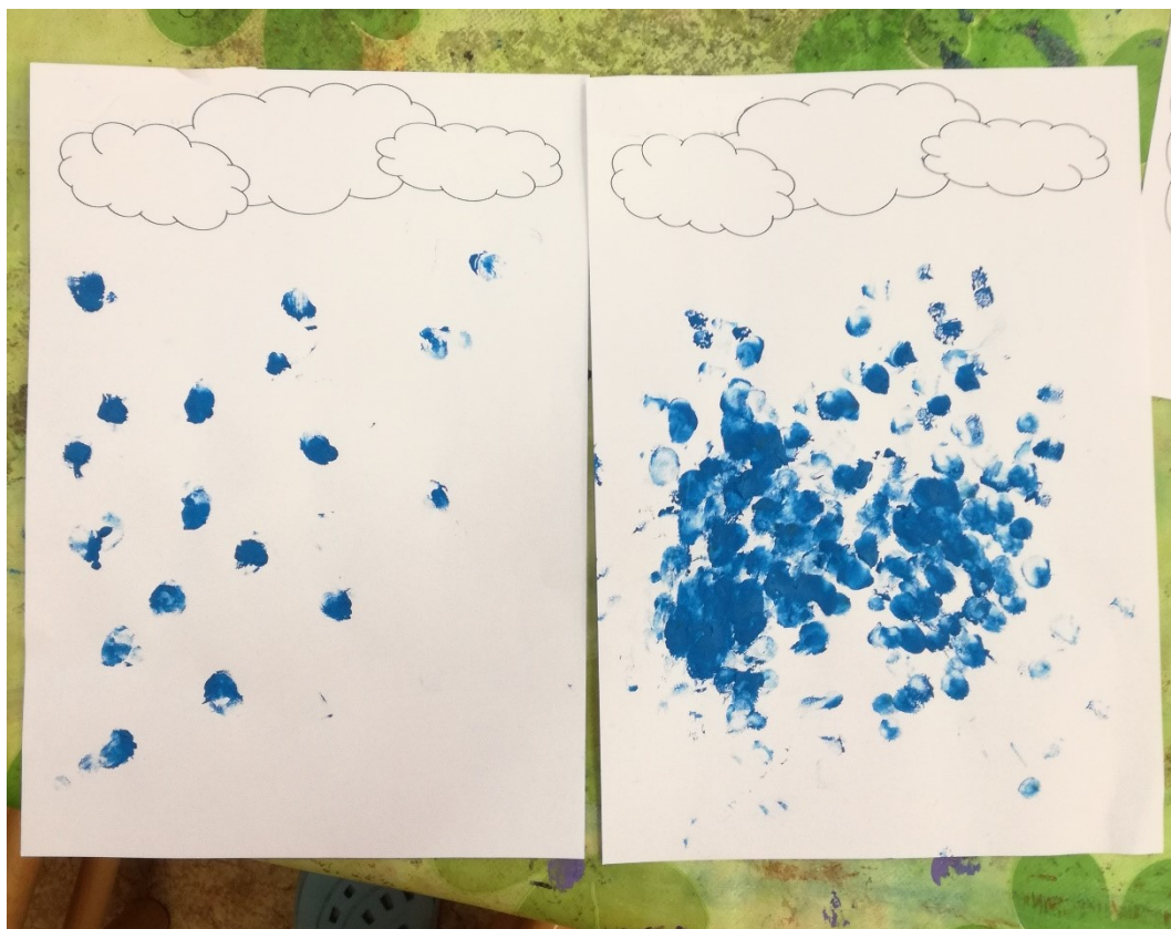
Obrázek 7 – Aktivita 3