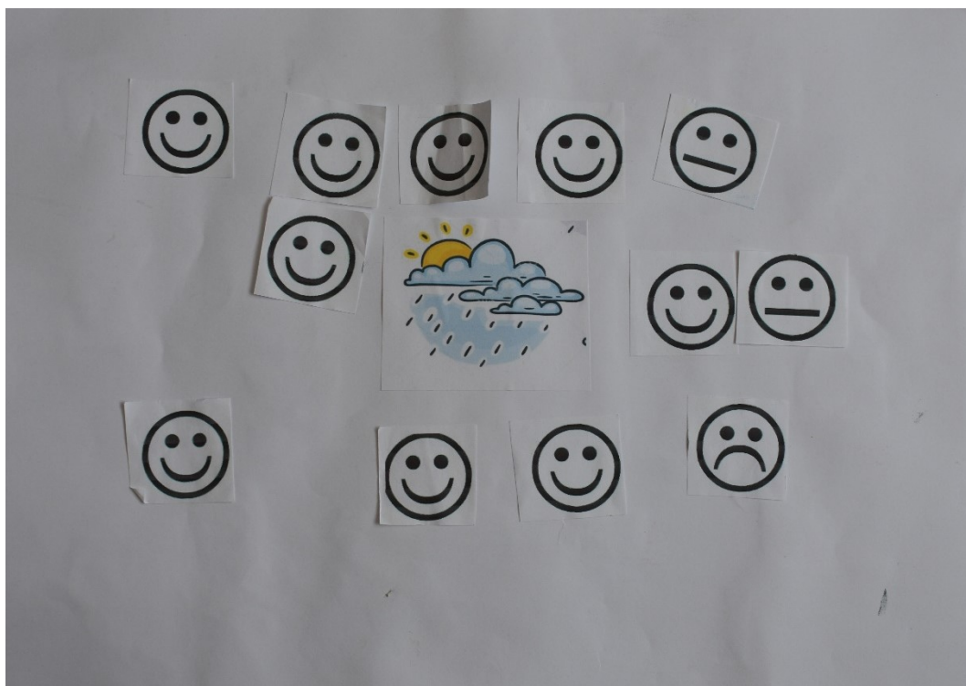
Obrázek 8 Hodnocení dětmi – Aktivita 3