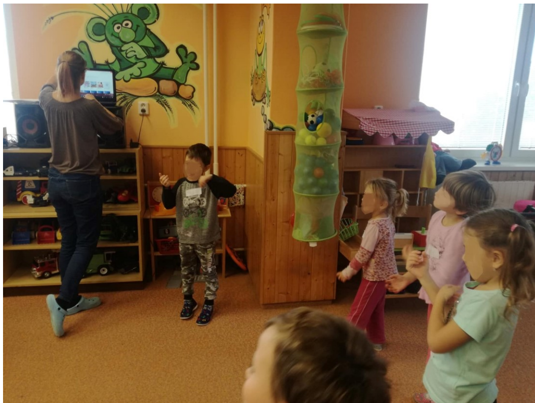
Obrázek 13 – Aktivita 6