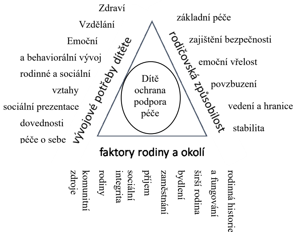
Obrázek 1 Hodnotící rámec (Pemová, Ptáček, 2016, s. 114)

rámec jako osnovu pro praxi, ale dále vyžaduje posuzovat individuálně potřeby dítěte a schopnosti rodičů i jejich rodinné a environmentální faktory s vlivem na vývoj dítěte a na kompetence rodičů (in. Pemová, Ptáček, 2016, s. 114).