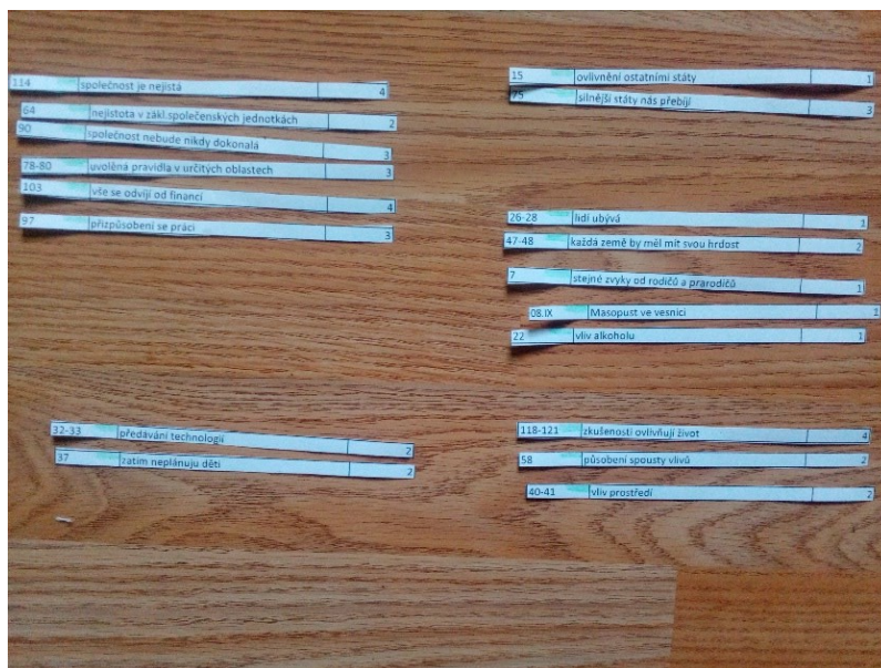
Obrázek 2 Ukázka třídění rodičích se témat