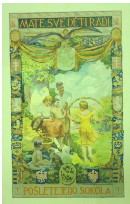
Obrázek č. 7 – Náborový plakát do Sokola, 1927