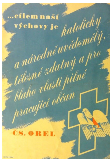
Obrázek č. 8 – Propagační plakát Orla, 1938