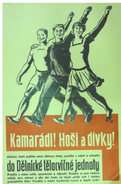
Obrázek č. 9 – náborový plakát DTJ, po roce 1920