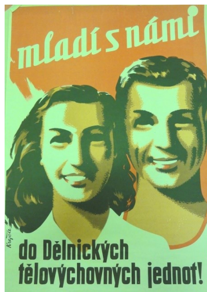
Obrázek č. 3 – Mladí s námi do Dělnických tělovýchovných jednot!, 1930