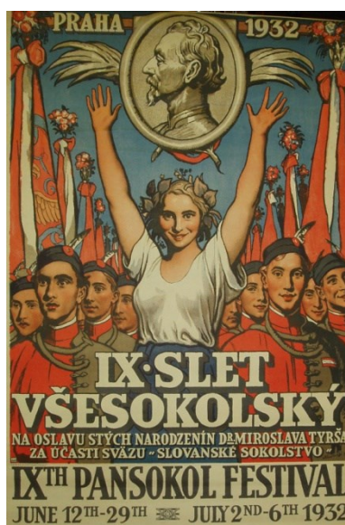
Obrázek č. 4 – IX. Vsesokolský slet, 1932