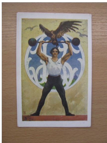
Obrázek č. 11 – Orelská pohlednice, nedatováno, (zdroj: Národní archiv, č. fondu 463, karton č. 123, inv. č. 559)