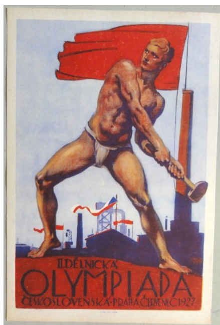
Obrázek č. 6 – II. Dělnická olympiáda, 1927