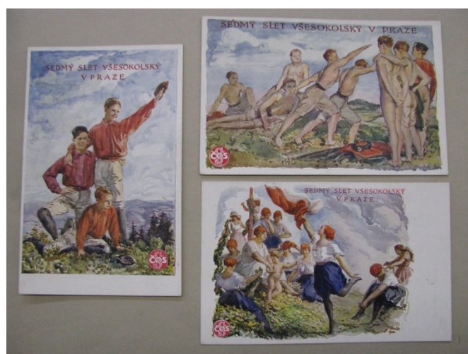
Obrázek č. 10 – pohlednice k VII. všesokolskému sletu, 1920, (zdroj: Národní archiv, č. fondu 463, karton č. 123, inv. č. 559)