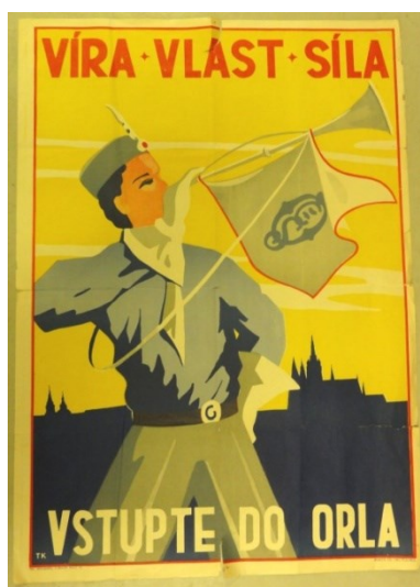
Obrázek č. 2 – Náborový plakát Orla, 1930