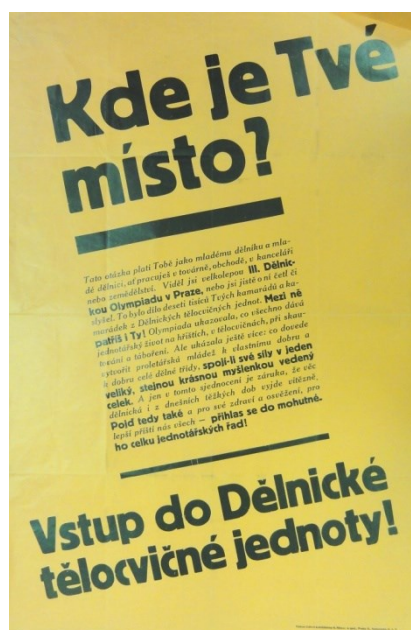
Obrázek č. 12 – náborový plakát DTJ, 1934