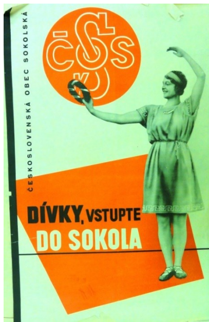
Obrázek č. 1 – Dívky, vstupte do Sokola, asi 1925 (zdroj: Národní museum. Archiv tělesné výchovy a sportu, Sb. plakátů, inv. č. 6222)