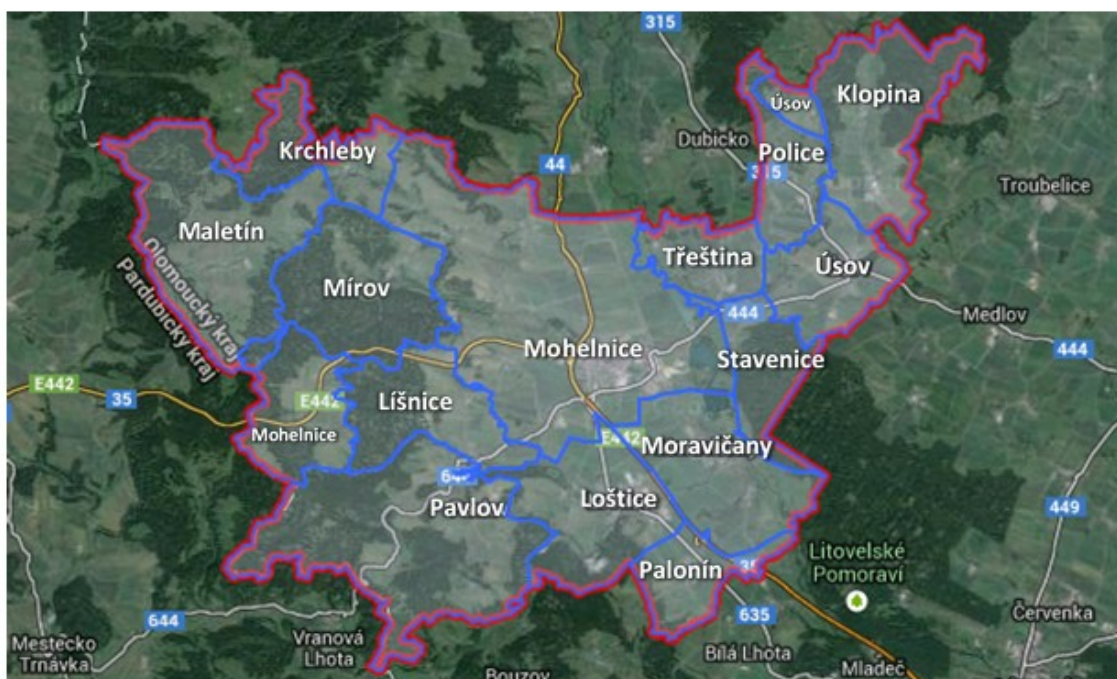
Obr. 2 Území Mikroregionu Mohelnicko

Obce mikroregionu: Klopina + místní část Veleboř, Krchleby , Líšnice + místní část Vyšehorky, Loštice + místní části Žádlovice a Vlčice, Maletín + místní části Starý Maletín, Nový Maletín a Javoří, Mírov + místní části Mírovský Grunt a Míroveček, Mohelnice + místní části Újezd, Podolí, Libivá, Květín, Řepová, Křemačov a Studená Loučka, Moravičany + místní části Doubravice a Mitrovce, Palonín , Pavlov + místní části Radnice, Veselí, Vacetín, Zavadilka, Svinov a Lechovice, Police , Stavenice , Třeština + místní část Háj, Úsov + místní část Bezděkov.