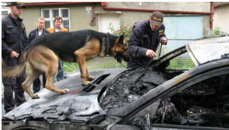
Obr. 2 Vyhledávání akceleraantů požáru automobilu [26].

případech je rozeznání pachu psem bráno jako důkazní materiál, konkrétně je považováno za nepřímý důkaz [15][20].