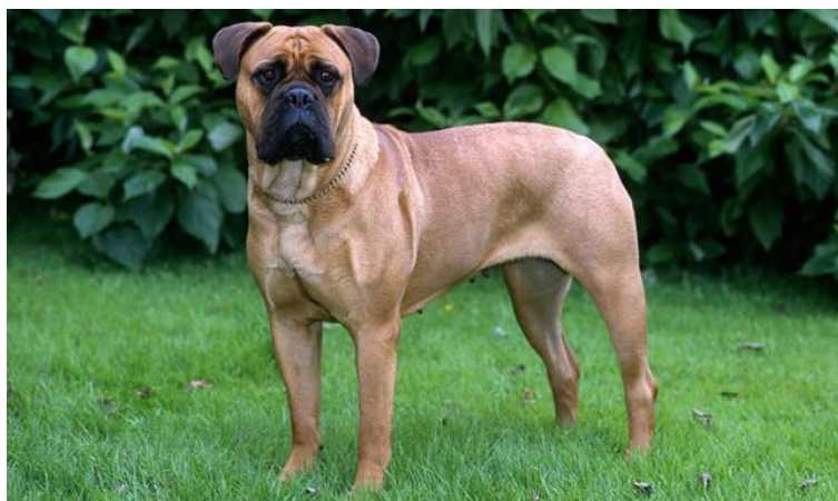
Obr. 7 Bullmastif [54].

Bullmastif je nesmírně masivní a působí robustně až neobratně. Opak je ovšem pravdou, toto plemeno je velmi energické a je s podivem, jakou dokáže vyvinout rychlost. I tyto vlastnosti činí z bullmastifa skvělého ochránce . Dorůstá se více než 65 cm, někdy může přesahovat i výšku 75 cm v kohoutku a v kombinaci s jeho vzhledem z něj přímo číší respekt. Hmotnost se může pohybovat až přes hranici 60 kg a pro bullmastifa tedy není sebemenší problém fyzicky zneškodnit i fyzicky zdatného pachatele . Výraznými znaky plemene jsou také široké svalnaté nohy a velká hlava se svěšenými ušima. Srst bývá nejčastěji plavá či načervenalá a díky její krátké délce je její údržba velmi snadná, vyžaduje jen zcela minimální péči [53].