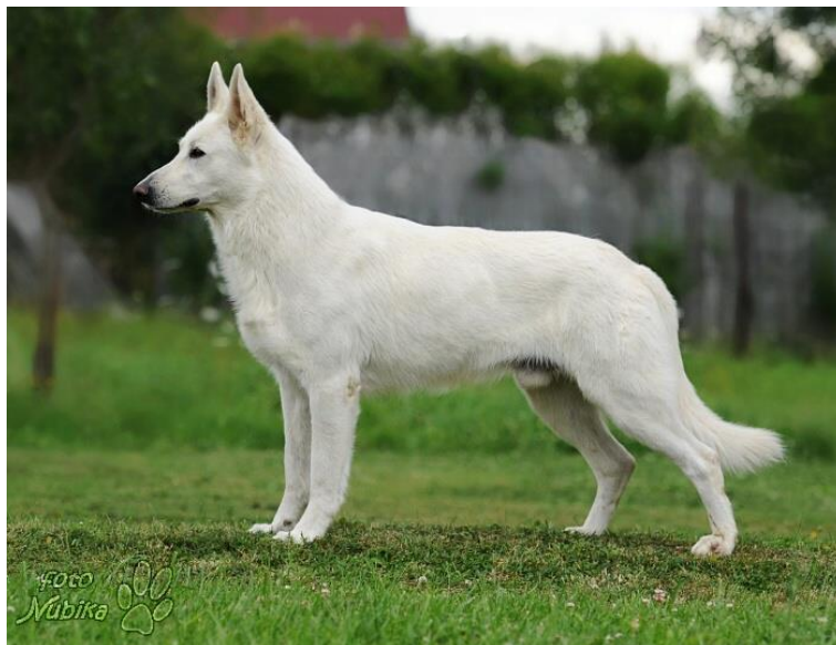
Obr. 15 Bílý švýcarský ovčák [72].

Jako většina ovčáků i bílý švýcarský ovčák má špičaté vzpřímené uši a podlouhlý zúžený čenich [71].