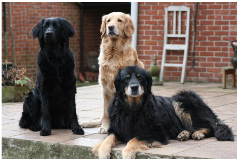
Obr. 4 Tři barevné varianty Hovawarta [47].

Co se povahy týká, je to velmi klidné a inteligentní plemeno, i když někdy lehce svéhlavé. Jsou to velmi ostrážití , trpěliví a věrní psi, jejichž výchova není příliš obtížná a jsou velmi dobře ovladatelní . Dalšími výhodami jsou respekt a výborná odolnost ve všech klimatických podmínkách, kdy zvládá mrazivé zimy i parná léta. Hovawart skvěle vychází s dětmi i zvířaty, zatímco k cizím lidem je velmi rezervovaný až nedůvěřivý, což z něj dělá skvělého hlídače. Dožívá se podobně jako slovenský čuvač přibližně 11 let. Jeho cena se pohybuje v rozmezí 4 000 – 8 000 Kč bez PP [45].