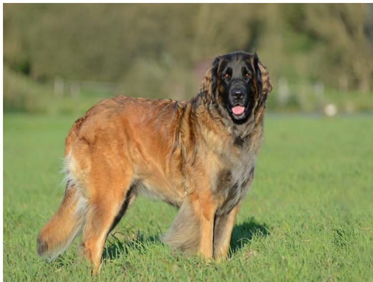
Obr. 5 Leonberger [49].

v době růstu příliš nezatěžovat. Štěňata rostou nesmírně rychle a jejich klouby mohou při špatném zacházení trpět [48].