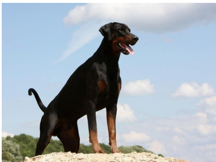
Obr. 12 Dobrman [65].

I když dobrman nepatří mezi robustní plemena, jde z něj velký respekt . Je výrazný hlavně díky své mohutné a svalnaté hrudi, zbytek těla je spíše užší. V kohoutku může měřit více než 70 cm a vážit přibližně 40 kg. Má velmi krátkou a hladkou srst, která je velice jednoduchá na údržbu, protože nevyžaduje téměř žádnou péči. Co se týče barvy, je nejčastěji uhlově černá s rezavými fleky kolem tlamy, na nohou a na hrudi. Někdy může dojít k záměně dobrmana za německého pinče. Tato dvě plemena jsou si velice podobná, ovšem mají dva podstatné rozdíly. Těmi jsou přibližně o 20 cm větší výška a o 20 kg větší hmotnost na straně dobrmana [64].