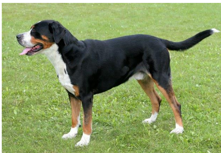
Obr. 17 Velký švýcarský salašnický pes [76].

Velký švýcarský salašnický pes má velmi mohutnou až zavalitou postavu. Zejména jeho hrud' je velmi široká a robustní, velká je i jeho hlava. Barvou srsti je podobný bernskému salašnickému psovi, liší se ovšem její délkou. U psa převládá černá barva, má bílou náprsenku, čenich a konce nohou. Zbytek nohou a koutky tlamy mívá hnědé. Srst je velice krátká a drsná, vyžaduje jen velmi nepravidelnou a nenáročnou péči. Velký švýcarský salašnický pes patří mezi velká plemena, jeho výška může být přes 70 cm v kohoutku a váha může být až 70 kg. Což znamená, že z tohoto plemene jde velký respekt .