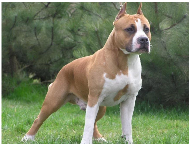
Obr. 13 Americký stafordširský teriér [67].

Toto plemeno je celkově menšího vzrůstu, ale podcenit jej by se pachateli mohlo ošklivě vymstít. Málokterý pes disponuje takovou silou, zuřivostí a zarputilostí , jako právě americký stafordširský teriér. Má velmi širokou hlavu a silné čelisti, které dokážou vyvinout přímo brutální stisk. Výškou se řadí mezi střední plemena, kdy dosahuje 48 cm v kohoutku. Jeho váha se pohybuje okolo 23 kg. Je zavalité postavy se svalnatou mohutnou hrudí. Také jeho končetiny jsou velmi silné a svalnaté. Výrazným znakem jsou také špičaté uši. Srst je velmi krátká, drsná a lesklá. Nevyžaduje téměř žádnou péči a zbarvení má většinou dvoubarevné. Většinou se jedná o kombinaci bílé a hnědé, či bílé a černé barvy [66].