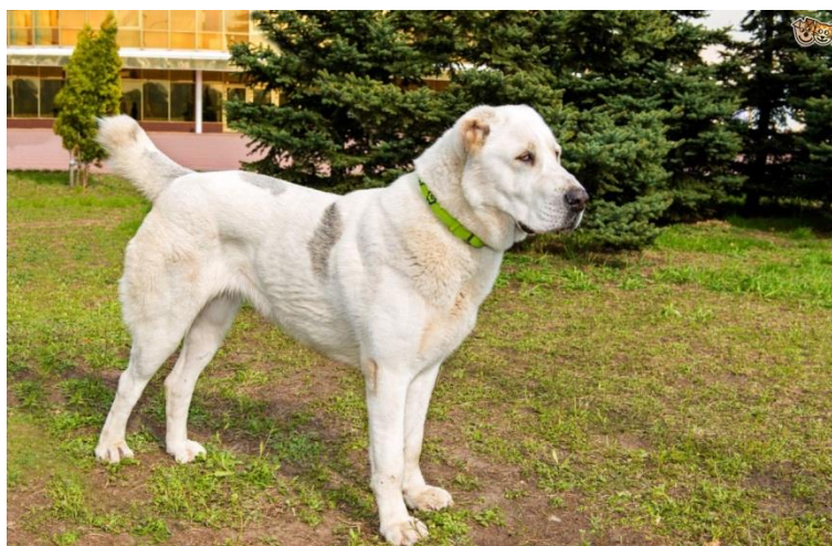
Obr. 9 Středoasijský pastevecký pes [59].

Středoasijský pastevecký pes má mohutné svalnaté tělo, které budí respekt . Má také velmi velkou širokou hlavu s relativně malými ušima a krátký tlustý krk. Celkově toto plemeno působí velmi neohrabaným a těžkopádným dojmem. Délka srsti se může lišit, ovšem nejčastěji bývá krátká a nevyžaduje téměř žádnou péči . Zbarvení bývá také různorodé, od bílé barvy přes šedou až po černou. Výškou v kohoutku dosahují až na 73 cm a jejich váha může přesahovat 60 kg [58].