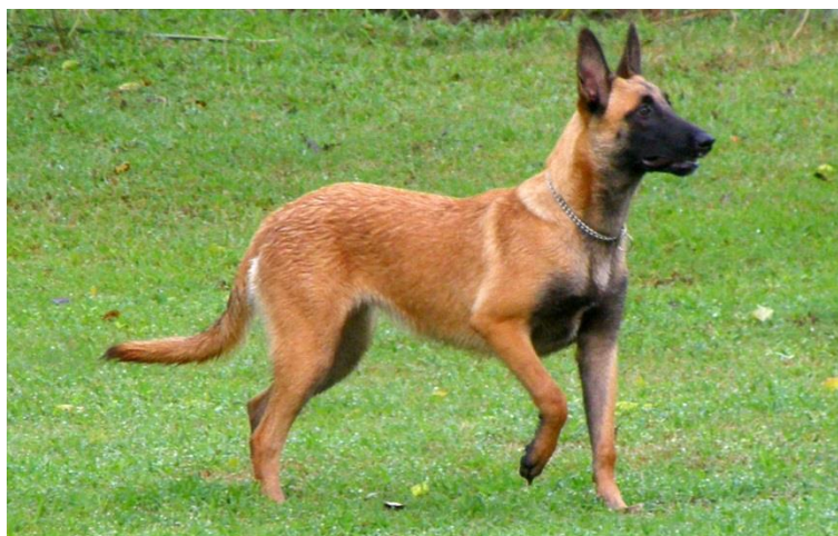
Obr. 8 Belgický ovčák – Malinois [57].

leonberger. Oproti němu je ovšem menší a hlavně podstatně drobnější. Dorůstá se 66 cm v kohoutku a může vážit maximálně 30 kg. I když malinois není příliš velkým a robustním plemenem, tyto aspekty nahrazuje svými schopnostmi. Je velmi silným a také neskutečně energickým a houževnatým plemenem.