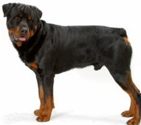
Obr. 16 Rotvajler [74].

Rotvajler je velmi mohutným a robustním plemenem. Má velmi širokou hlavu s malými ušima. Také jeho tělo je velmi robustní a svalnaté. Vzhledově vypadá velmi nepřátelsky a vzbuzuje obrovský respekt . Srst má velmi krátkou, zbarvením černou se světle hnědými skvrnami v oblasti hrudi, kolem tlamy a na nohách. Srst nevyžaduje velkou péči. Rotvajler se dorůstá téměř 70 cm v kohoutku a jeho váha se pohybuje přes 50 kg [73].