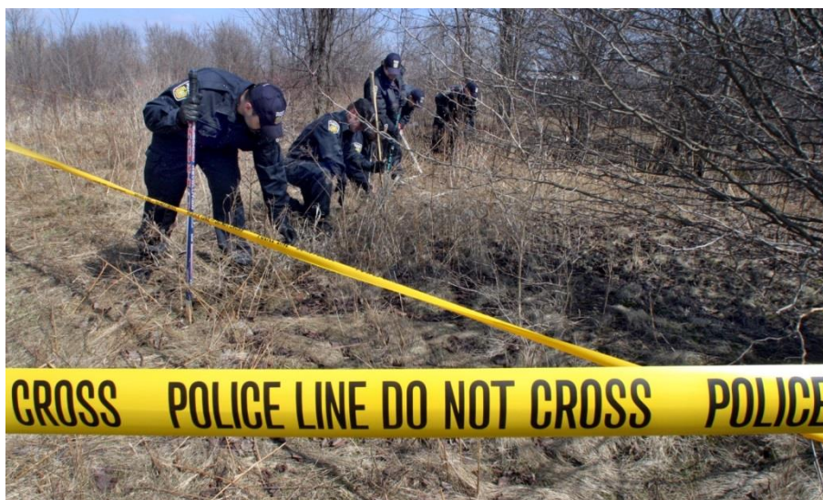
Obr. 18 Policisté prohledávají okolí místa činu [77].

První možností využití je přímo na místě trestného činu. Vše začíná ohlášením tohoto činu na některou ze státních složek, ať už na městskou policii, státní policii nebo na číslo 112. Složky se mezi sebou kontaktují a vyšlou své jednotky na místo činu. Městská policie nesmí vyšetřovat trestný čin sama, vždy musí kontaktovat také policii státní. Po příjezdu na místo se místo činu zajistí, a pokud došlo k použití střelné zbraně, snaží se ji jednotky najít. Nejprve se bez použití služebního psa důkladně prohledá okolí místa činu, v některých případech se k tomu používají i detektory kovu.