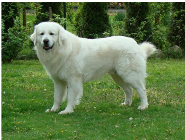
Obr. 3 Slovenský čuvač [44].

Slovenský čuvač se v průměru dožívá přibližně jedenácti let a jeho cena bez PP je 6 000 – 8 000 Kč , tedy poměrně přijatelná s ohledem na jeho skvělé schopnosti. Tento pes je také vhodný společník a velmi dobře vychází s dětmi i se zvířaty, což umožňuje jeho nasazení k ostraze objektu i s více psy. Jedinou menší nevýhodou je potřeba značného množství pohybu, jeho využití by tedy bylo vhodné spíše pro střežení na volno, než na stanovištích pevných či pohyblivých [43].