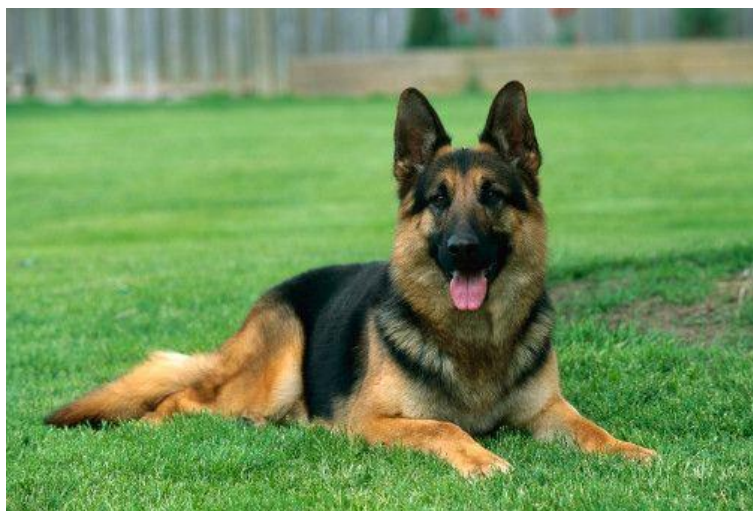
Obr. 6 Německý ovčák [52].

Oproti dříve zmíněným plemenům se německý ovčák nepovažuje za plemeno velké, ale pouze střední. Ovšem svou výšku dokonale nahrazuje jinými přednostmi, je nesmírně silný a také hbitý . Typickým znakem plemene jsou jeho vzpřímené špičaté uši, které se u štěňat začínají stavět přibližně ve věku 3 – 5 měsíců. Do té doby jsou relativně náchylné, a proto by se po nich štěňata neměla příliš hladit, či se jich nějak jinak dotýkat. Tělo ovčáka je značně svalnaté a může měřit až 66 cm v kohoutku. Co se váhy týká, většinou bývá přibližně 40 kg, ale někteří jedinci mohou vážit i kolem padesáti kil. Podle srsti se rozlišují dvě varianty německé ovčáka, a to krátkosrstá a dlouhosrstá. Pro využití v bezpečnostních agenturách je vhodnější kratší srst z důvodu snazší údržby a také lepší snášenlivosti vysokých teplot [50].