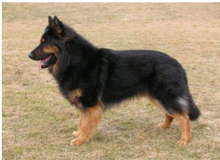
Obr. 14 Chodský pes [70].

temperamentním plemenem, nikoliv však agresivním. Je však velmi energický a vyžaduje pozornost či nějakou aktivitu. Pokud je například dlouho uzavřen ve stísněných prostorách bez možnosti většího pohybu, je možné, že si tento nedostatek bude vybíjet destruktivně směrem ke svému okolí. Může tedy například zničit nábytek apod. Dalšími vlastnostmi chodského psa jsou velká síla a hbitost .