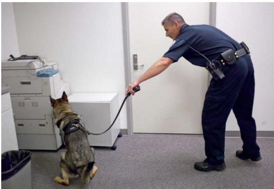
Obr. 20 Pes označuje nález zbraně sednutím [80].

návrh státního zástupce vydat povolení k domovní prohlídce, nebo například k prohlídce automobilu apod. Tuto prohlídku provede policejní orgán, a pokud nenalezne zbraň, povolá psovoda se psím specialistou. Ten dokáže vyhledat zbraň skrytou například v podlaze či jinak ukrytou. Vyhledávání zbraní se tedy provádí nejen na místě činu a jeho okolí, ale také v domech, bytech a jiných objektech, v automobilech a dalších dopravních prostředcích atd. [79].