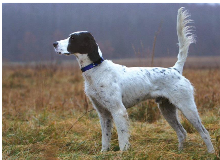
Obr. 10 Anglický setr [61].

Mnohými lidmi je anglický setr považován za jednoho z nejkrásnějších, či dokonce nejkrásnějšího ze všech loveckých psů. To ovšem pro bezpečnostní agentury není podstatné. Přestože nepatří mezi největší psy, disponuje nesmírnou silou a hbitostí. Jeho výška může být až 68 cm v kohoutku, váha mezi 25 a 30 kg. Není tedy ani příliš robustní, ale respekt si zjednat dokáže. Dále má dlouhou jemnou srst, která může nabývat dvou či tříbarevných kombinací. Základní barvou je většinou bílá a jako druhá barva může být hnědá či černá tvořící na jeho těle různé skvrny a přechody. Nevýhodou je, že srst anglického setra vyžaduje pravidelnou péči [60].