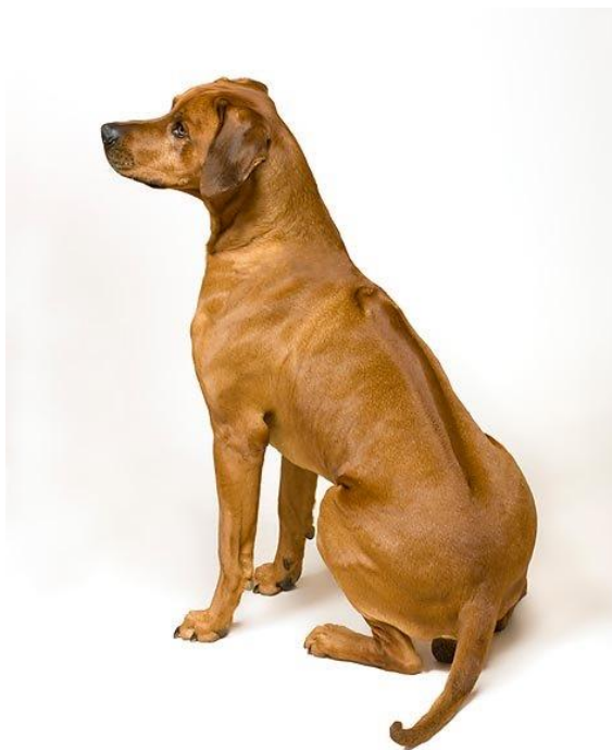
Obr. 11 Rhodéský ridgeback [63].

Původem je toto plemeno z Jihoafrické republiky, i když poprvé bylo popsáno v Zimbabwe. Konkrétně v oblasti Rhodesie, odtud pojmenování rhodéský. Ridgeback není pouze rhodéský, ale také například thajský. Samotné slovo ridgeback pochází z angličtiny a volně přeloženo znamená hřbet zpět, což poukazuje na základní rozeznávací znak tohoto plemene. Tím je pruh protichůdně rostené srsti právě na hřbetu. Dle FCI se rhodéský ridgeback řadí mezi honiče, barváře a příbuzná plemena [62].