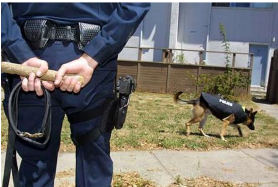
Obr. 19 Psovod skrývá hračku, zatímco pes vyhledává zbraň [78].

Poslední možností při vyhledávání zbraní je tedy povolání psovoda. Ten je po příjezdu obeznámen se situací a je mu sděleno, kde by se přibližně zbraň mohla vyskytovat. Psovod poté se psem začne vyhledávat zbraň za použití povelu „hledej“. Postupuje tzv. kruhovým pátráním, kdy začne kruhem v bezprostřední blízkosti místa činu a poté kruh zvětšuje. Hledání nesmí probíhat příliš dlouho, musí se dělat časté pauzy, jelikož pes neudrží dlouho pozornost. Dalším způsobem hledání je postupování po pravděpodobné cestě útěku pachatele, kdyby náhodou zbraň při útěku odhodil.