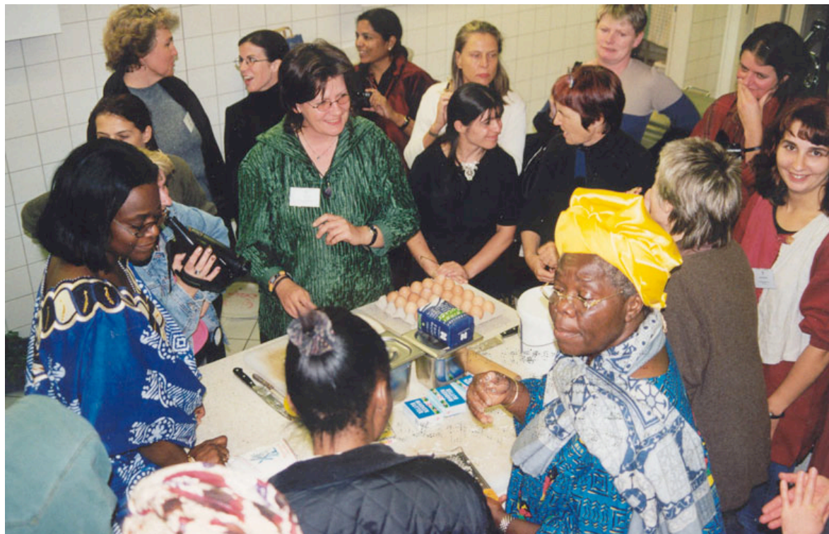
MINE – Světová síť MC