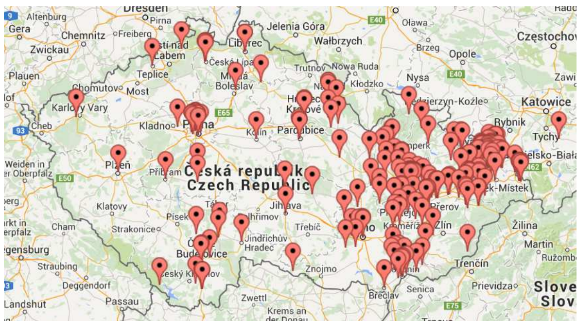
Obr. 2. Mapa obsahující přehled institucí proškolených v rámci projektu E-Bezpečí

Mapa ukazuje místa provedených školení, kde v rámci terénních akcí projektu E-Bezpečí bylo od r. 2008 doposud proškoleno více než 23 000 žáků a studentů základních a středních škol, přes 2600 učitelů základních a středních škol a několik tisíc policistů a rodičů se zaměřením na oblast rizikové komunikace v prostředí internetu a s ním související negativní komunikační jevy.