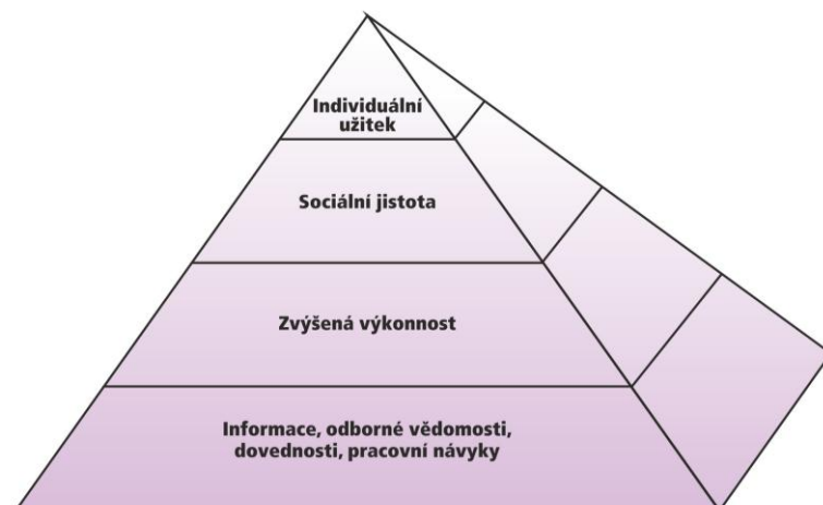
Obrázek č. 2 - Pyramida motivace učení

Z hlediska účastníka vzdělávání je možno pyramidu učebních motivů ukázat na následujícím obrázku: