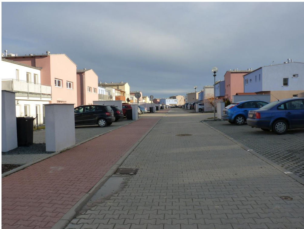
Třetí etapa nové zástavby v Popůvkách, dva byty a jeden mezonetový dům tvoří jedno číslo popisné, zdroj: vlastní foto