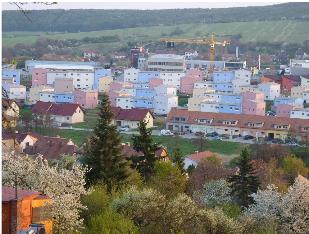
Nová zástavba v Popůvkách