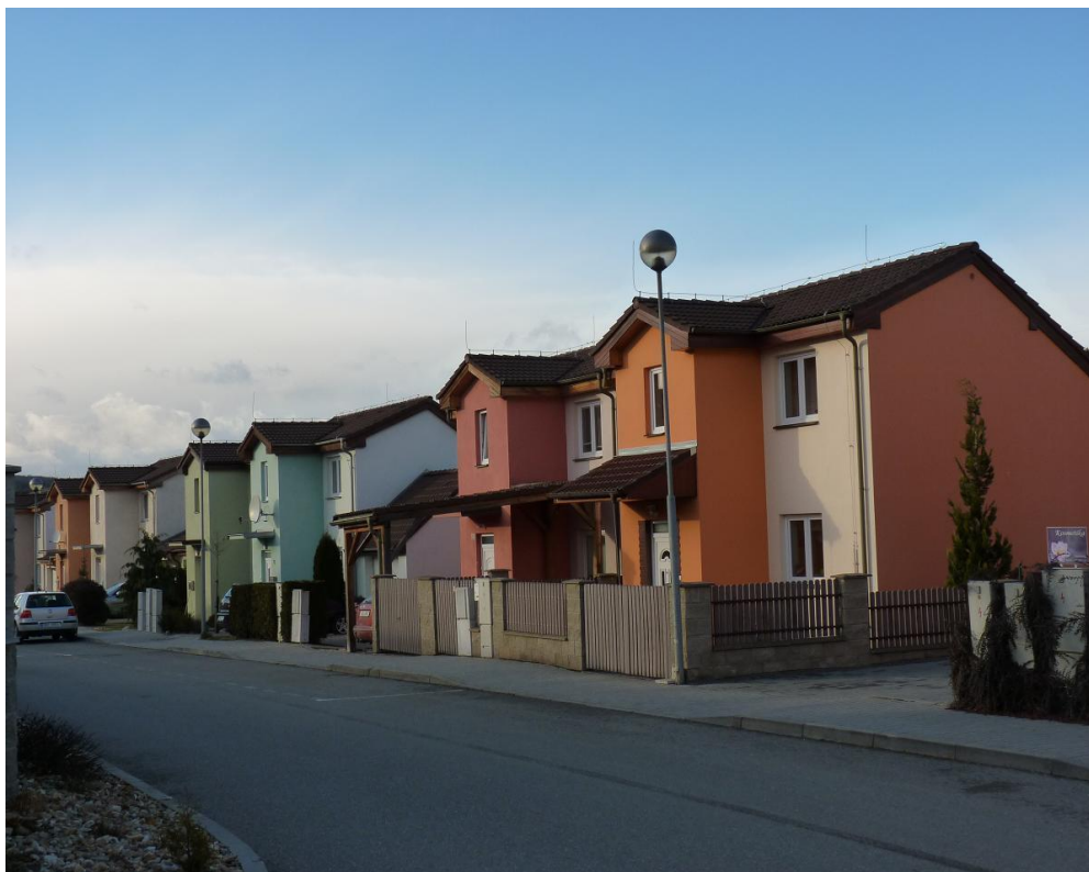
První etapa nové zástavby v Popůvkách, rodinné domy