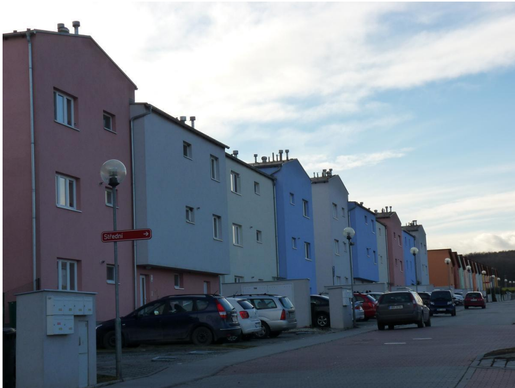
Druhá etapa nové zástavby v Popůvkách, bytové domy