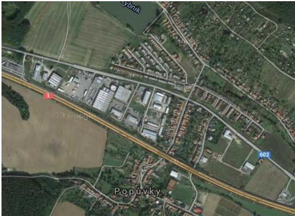
Obec Popůvky