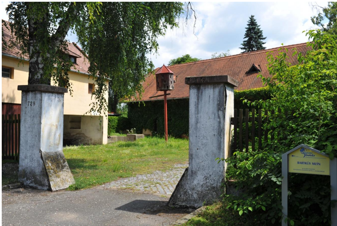
Bartk v mlýn- jedno z možných míst narození J. A. K.