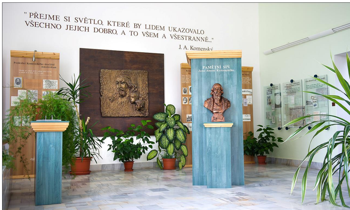
Pamětní síň J. A. Komenského v aule Z TM v Nivnici