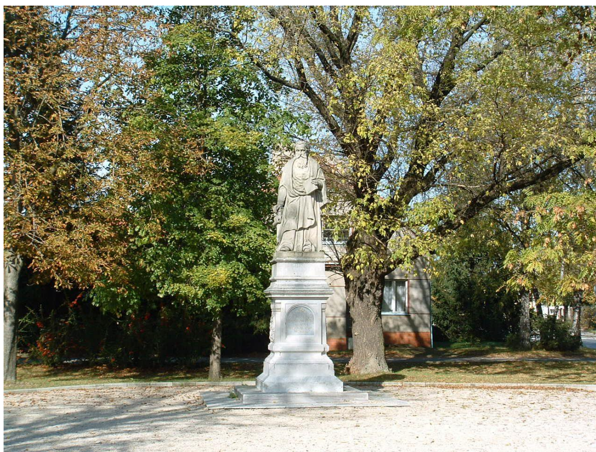
Socha J. A. K. v parku v Nivnici