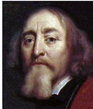
Obr. č. 1 - Jan Amos Komenský