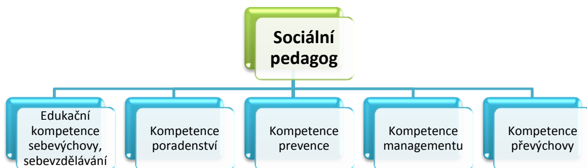
Obr. 3. Specifické kompetence sociálního pedagoga.