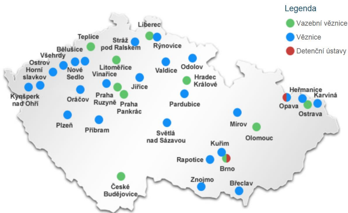
Obr. č. 4: Organizační jednotky Vězeňské služby ČR