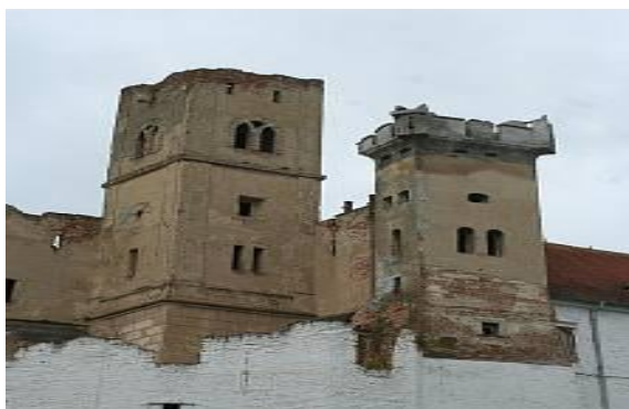
Obrázek 3 Vyhlídková věž

Vedení města chce opravit zámeckou věž a udělat z ní vyhlídku. Měla by sloužit turistům a postupně přilákat i nové investory. Zatím městu chybí počáteční finance. Mělo by jít o 6 milionů Kč. Věž je vysoká dvaatřicet metrů a je z ní pěkný výhled na Břeclav a okolí.(Ševčík, 2011)