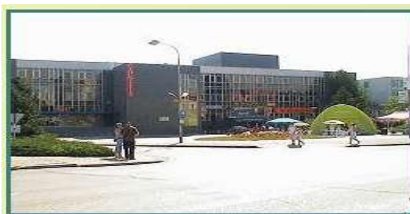
(Kulturní dům Delta, 2006)