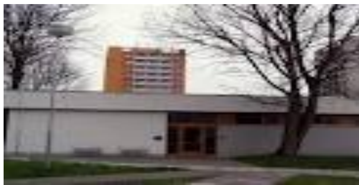
Obrázek 6 Muzeum a galerie Břeclav

V rámci doplňkové činnosti pořádá Městské muzeum a galerie Břeclav pravidelné kulturní a vzdělávací akce, galerijní výstavy a jinak společensky přínosné akce sloužící široké veřejnosti. (Muzeum a galerie Břeclav, 2012b)