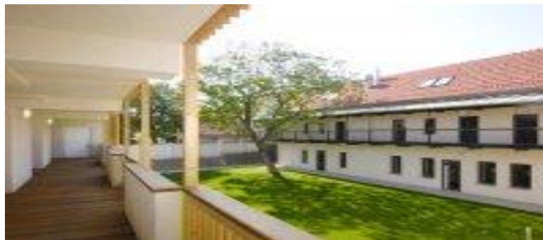
(Dřevčický park, 2010)