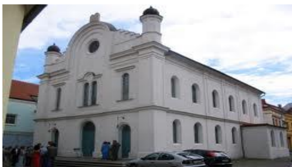
Obrázek 7 Synagoga

Byla postavena v roce 1868. V roce 1888 ji významný vídeňský architekt Max Fleischer renovoval v novorománském slohu. (Muzeum a galerie Břeclav, 2012) Po 2. světové válce sloužila jako skladiště, v letech 1997 - 1999 prošla celkovou rekonstrukcí a nyní je využívána ke kulturně - společenským účelům. (Muzeum a galerie Břeclav, 2012c)