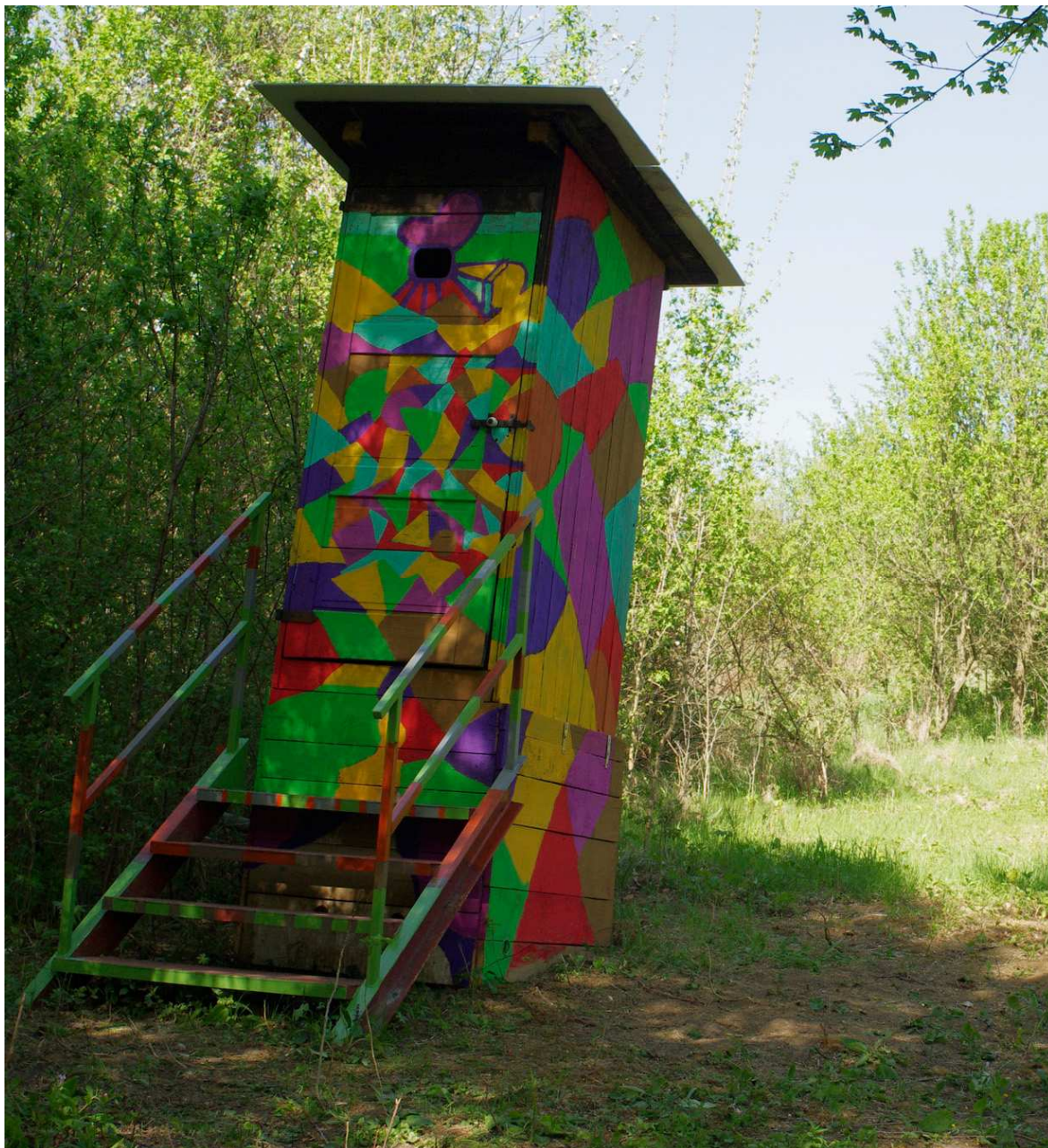
Obr.3- objekt kadibouda