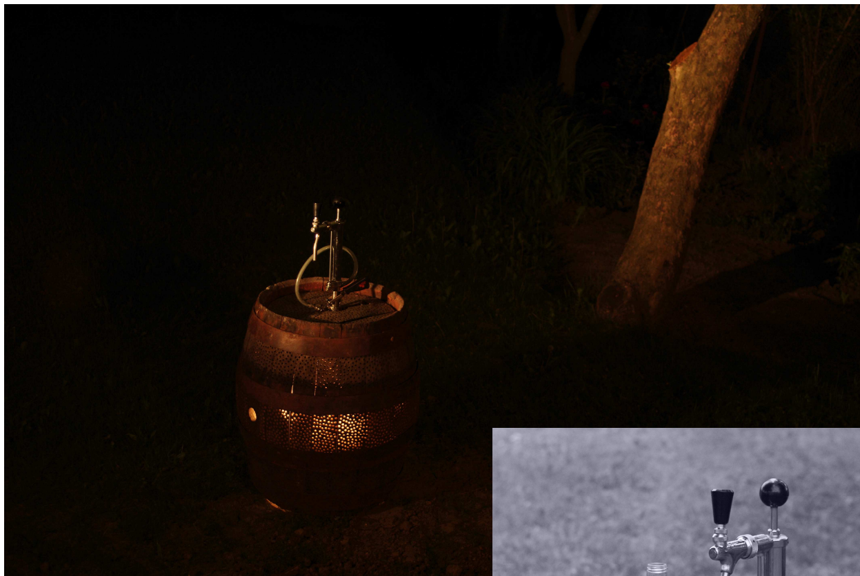
Obr.1- svítící objekt