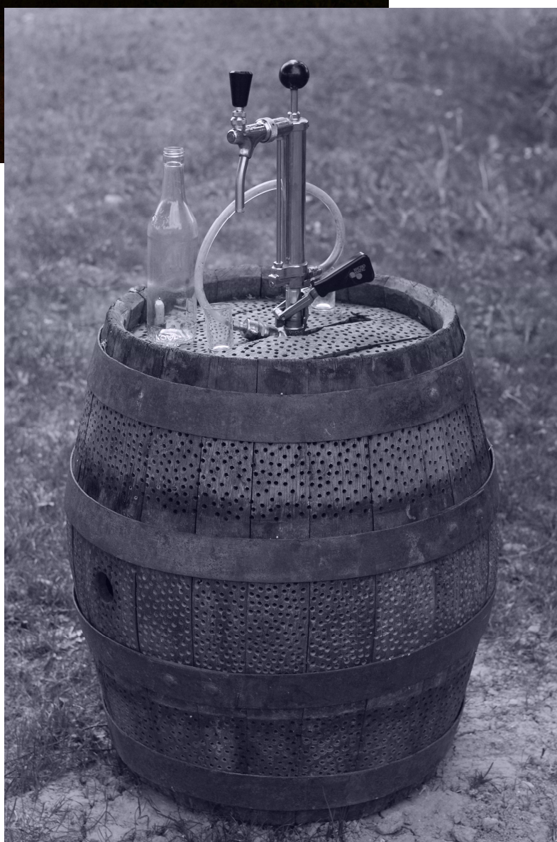
Obr.2- objekt bečka