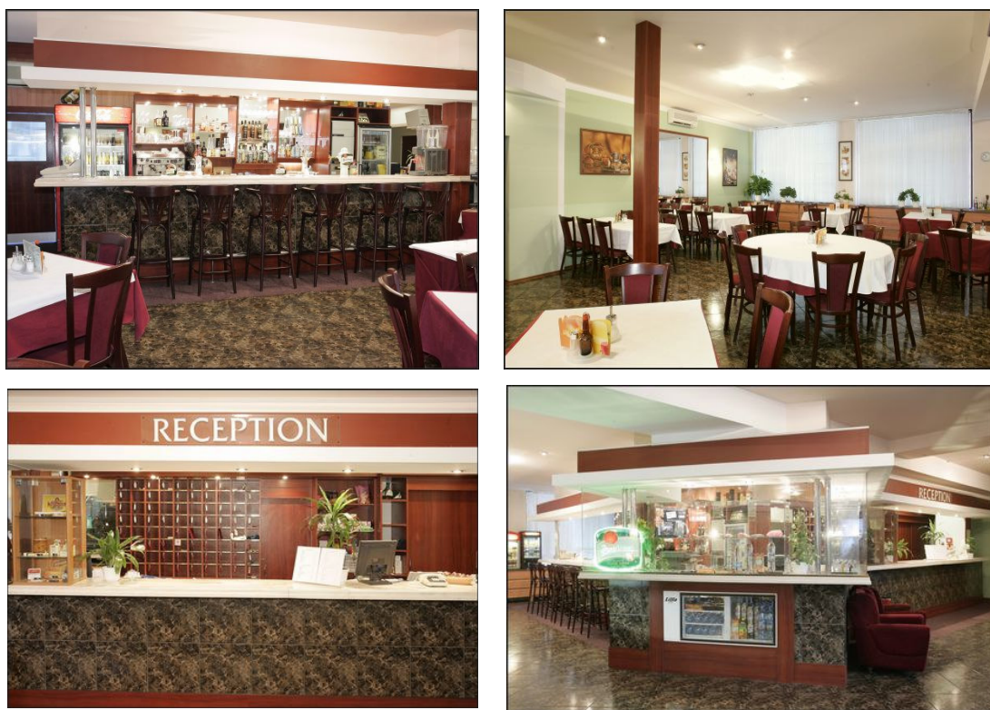
Obr. 2. Hotelový bar, reštaurácia, recepcia