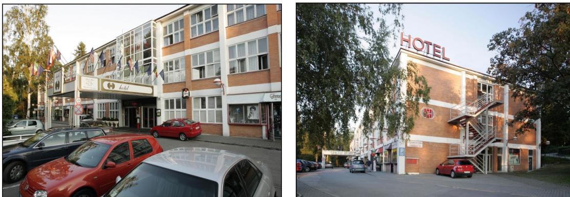
Obr. 1. Hotelový objekt

Ochrana bezpečnosti v súčasnej dobe nesporne vyžaduje komplexný a systémový prístup. Ochranu bezpečnosti nemožno vidieť iba v zaistení vonkajšej (obvodovej) ochrany objektu patriacich príslušnému subjektu, ale je ju potrebné chápať ako zložitý systém tvorený subsystémom.