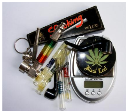
Obr. 8. Kuřácké pomůcky 52