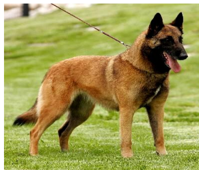
Obr. 6. Belgický ovčák 45