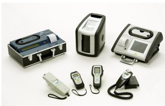
Obr. 1. Alkohol test Dräger 34

má možnost přístroj přenést bezdrátově do počítače nebo mobilní tiskárny Dräger a vytisknout. 33