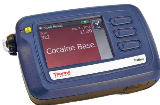
Obr. 4. Spektrometr TruNarc 41

Tento přístroj umožňuje v současné době efektivně reagovat na rychle se měnící podmínky na drogové scéně. Je velkou pomocí pro policisty, celníky a ostatní složky. 40