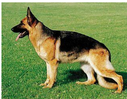
Obr. 5. Německý ovčák 44

Psí specialisti jsou také vycvičeni pro pachové práce. Psi mají citlivé čichové buňky, které jsou větší 6 – 40krát než u člověka. Jsou schopni najít nejrůznější ukryté omamné a psychotropní látky i v malém množství. K nejpoužívanějším „drogovým psům“ patří plemena německý a belgický ovčák a labradorský retrívr.