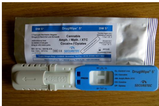
Obr. 2. Test DrugWipe 5 36

Dalším detekčním testem je drogová souprava testů NIK a NARK . Jedná se o rychlé jednorázové orientační testy na detekci drog z podezřelých pevných i kapalných vzorků. Užívají se při podezření na užití omamné a psychotropní látky. Detekují např. metamfetamin – pervitin, amfetamin, opiáty, kokain, LSD, heroin, marihuana, hašiš. Jsou určeny k orientačnímu testování drog a používá je také Policie České republiky.