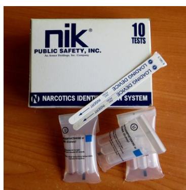
Obr. 3. Test Nik 38

Test U – Metamfetamin (Pervitin), amfetamin, MDMA (extáze). 37