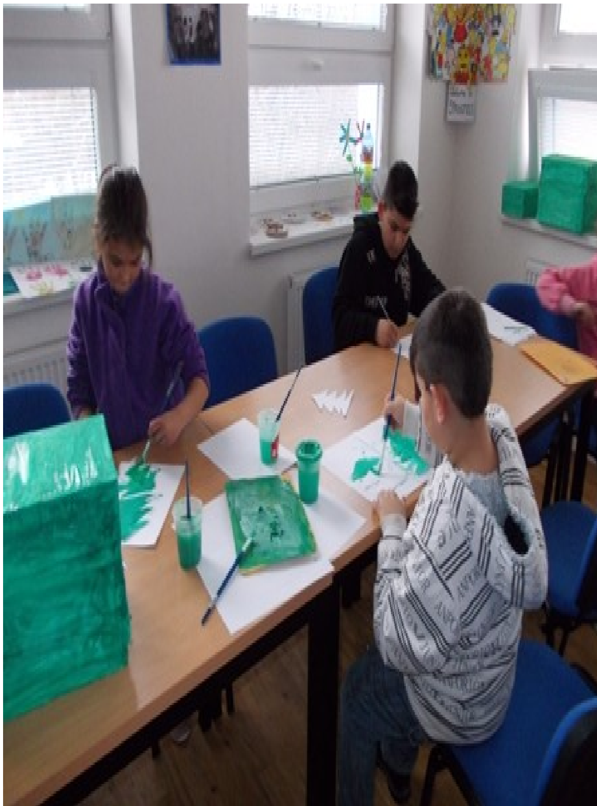
Výroba loutkového divadla v rámci volnočasových aktivit v KC Maják