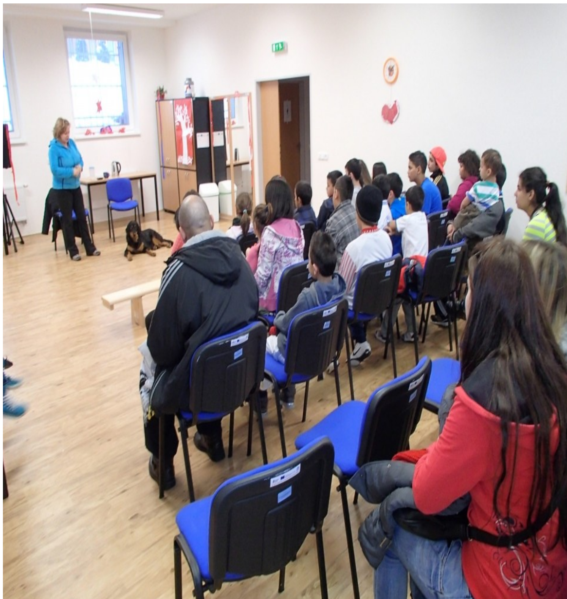
Kynologická přednáška v rámci volnočasových aktivit v KC Maják