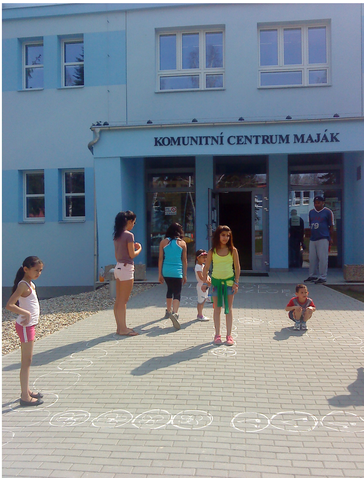
„Člověče nezlob se“ KC Maják