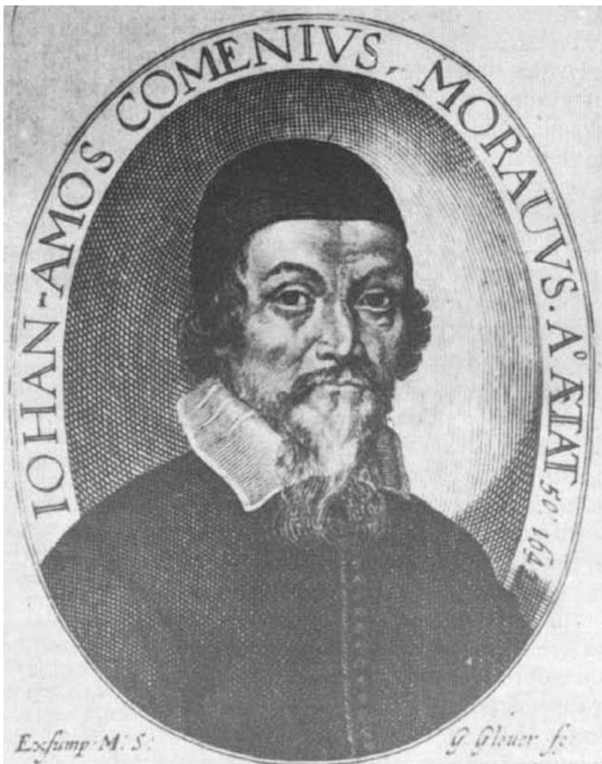
Jan Amos Komenský - portrét