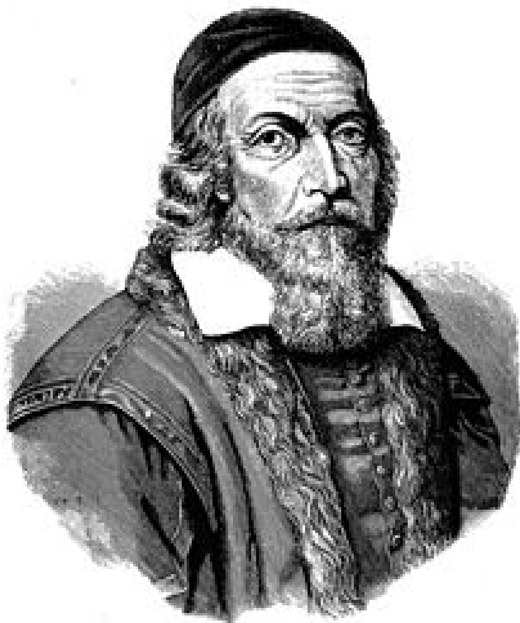
Jan Amos Komenský – portrét