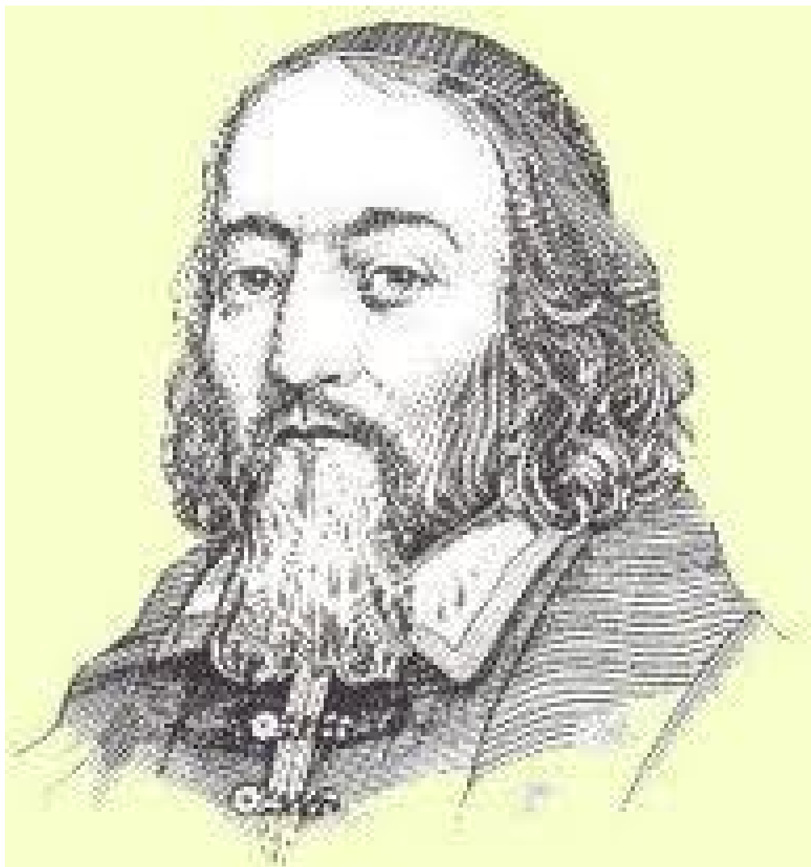
Jan Amos Komenský - portrét