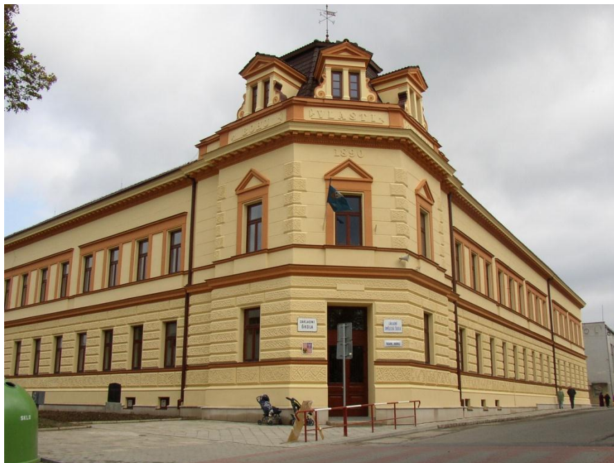
Obr. 2 Budova ZŠ Fryšták