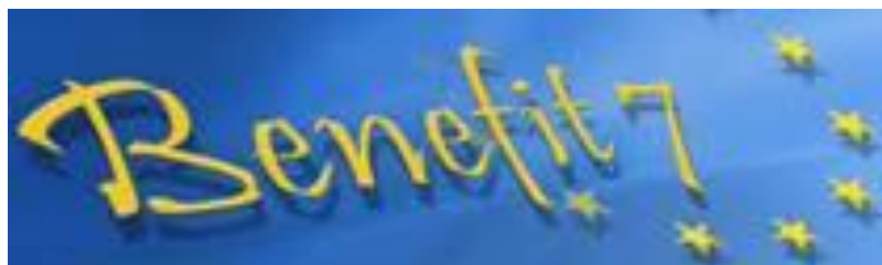
Obr. 3 Logo internetové aplikace Benefit 7

Aplikace Benefit 7 slouží k elektronickému podání projektové žádosti o podporu ze strukturálních fondů EU a ze státního rozpočtu. Tato aplikace je volně přístupná na internetových stránkách www.eu-zadost.cz .