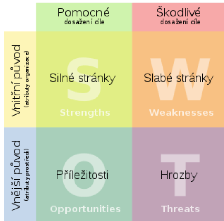
Obr. 1 SWOT analýza