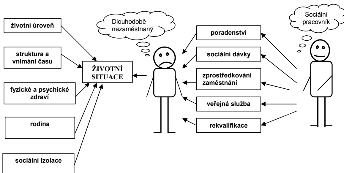
Obr. 1 Grafické znázornění působení změny v životě nezaměstnaného a vztah sociálního pracovníka.

Na výše znázorněném obrázku jsem se pokusila o grafické znázornění působení jednotlivých sociálních důsledků, které ovlivňují životní situaci nezaměstnaného v době evidence na úřadu práce a současně v době pobírání dávek hmotné nouze. Za povšimnutí stojí znázornění sociálního pracovníka, který v rámci své profese působí na klienta v jeho tíživé situaci a jeho možnosti intervence.