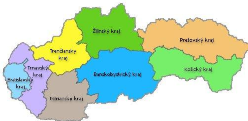
Obrázek 1: Kraje Slovenské republiky

Samosprávný kraj je samostatným územním samosprávným a správním celkem Slovenské republiky. Každý kraj má své zastupitelstvo, které je složeno z poslanců zvolených ve volbách. Vyšší územně samosprávné celky jsou vymezeny územími 79 okresů. Základní územně samosprávnou jednotkou jsou obce. Na území Slovenské republiky je celkem 2891 obcí. [22]