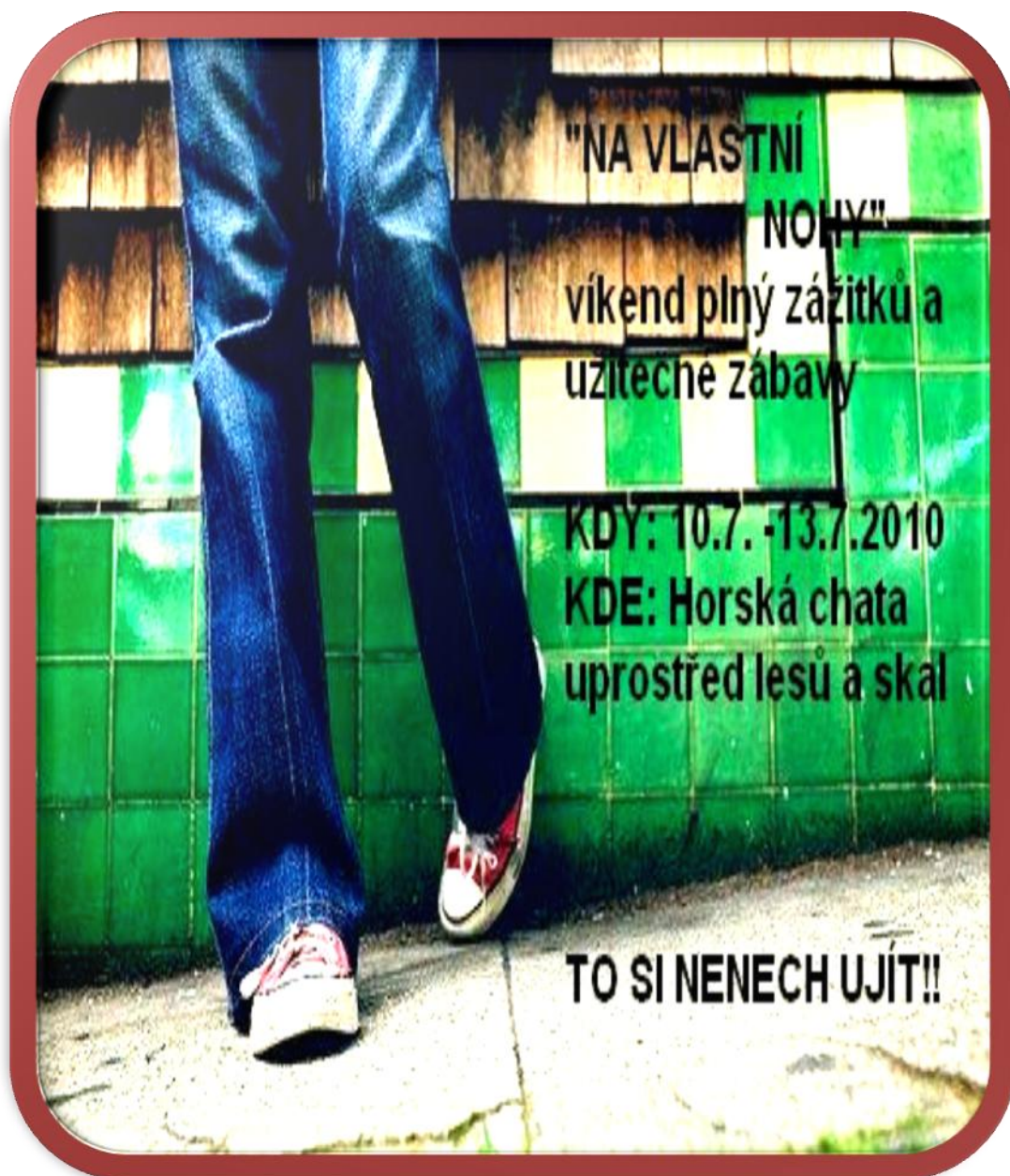
PŘÍLOHA P III- Obrázek 2 plakát na víkendový kurz