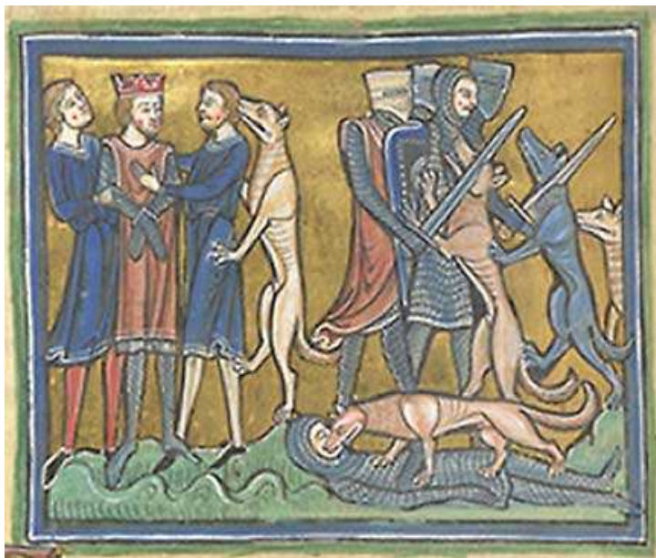
Obr. 3: Znázornění léčení pomocí psího lízání ve středověku

V Babylónii a Sýrii lékaři uctívali Gulu - ochranné božstvo lékařského umění, které mělo v emblému psa. Psi byli používáni na léčení ve velkých chrámech. Pacienti byli léčení pomocí psího lízání. Pes patřil k výbavě babylonského lékaře kvůli léčivé síle jeho slin.