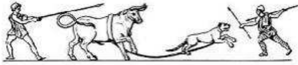
Obr. 1: Znásobení síly bojovníka zvířetem

Dlouhou historii vzájemného propojení těchto vztahů představují dochované památky z období starověku. Staří Řekové vnímali zvláštní pozitivní vliv zvířete na člověka. Zbožné uctívání je nezanedbatelným důkazem dominantního postavení zvířete po boku člověka v tak dávné době.