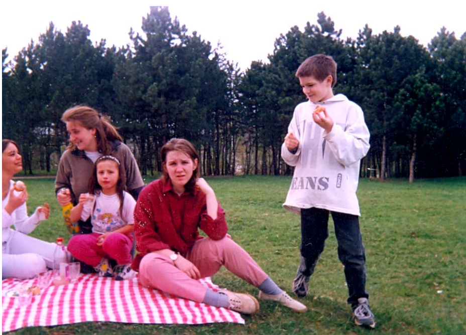
Malý opravář a piknik v okolí domečku