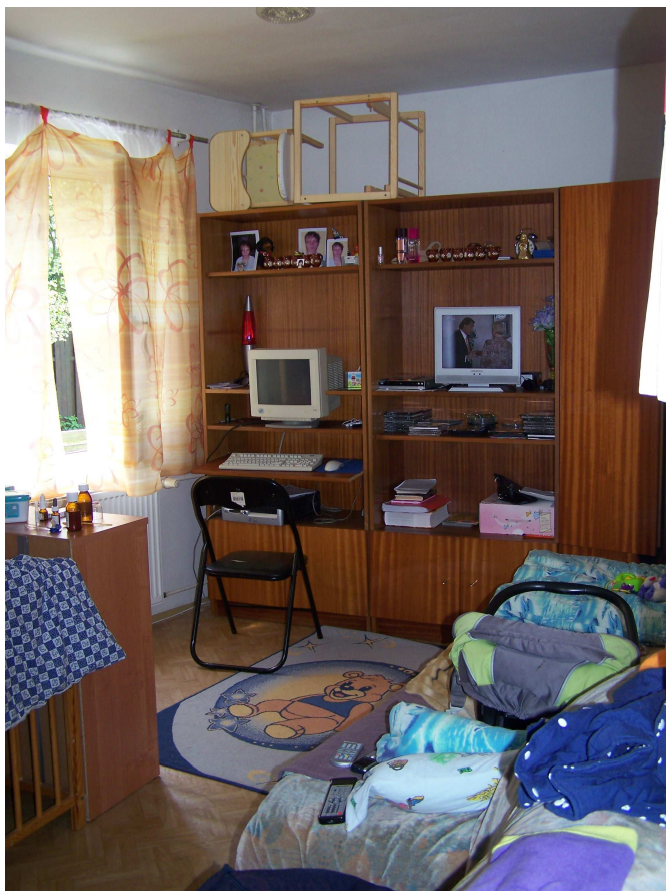
Obr. č. 9. Obyvatelka d.n.p.c. „Pod křídly“