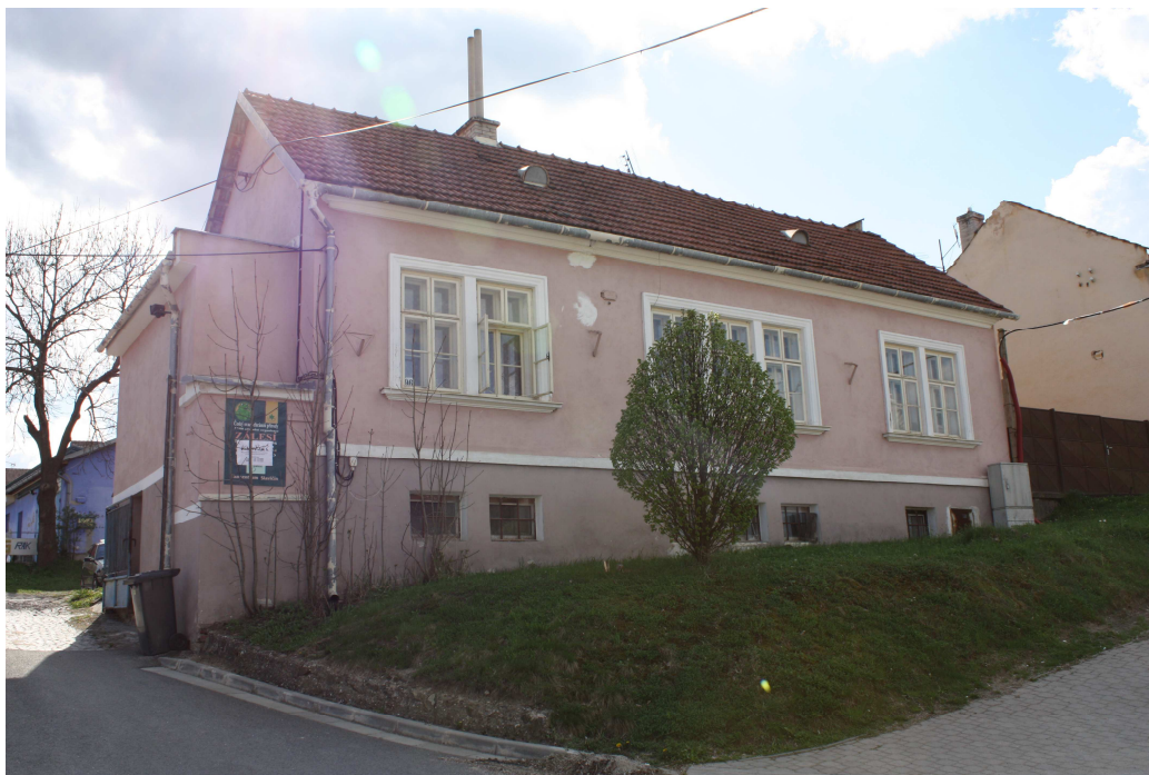
Obr. č. 12. Budova Nadace Jana Pivečky, učená pro zbudování domu na půli cesty