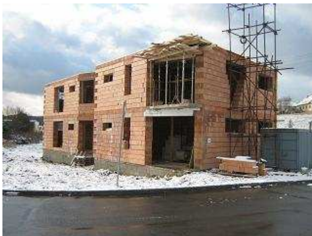
Obr. č. 5. Rekonstrukce Domu č. 1 ve Valmezu