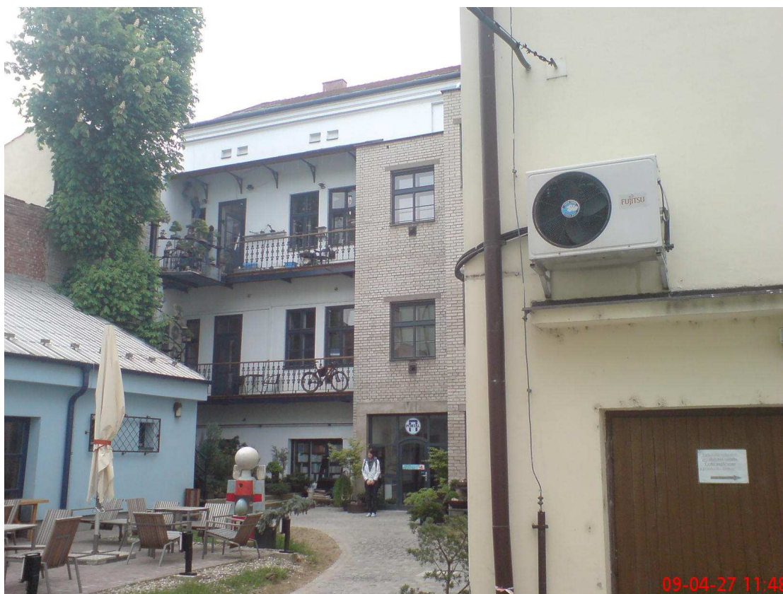
Obr. 3 pohled na Portál z vnitrobloku

Zajímavý prostor atria je vymezen nesoudrými OBJEKTY okolních domů. Taktéž výrazově jsou domy velmi odlišné. Plocha atria zabírá přibližně 450 m 2 . V atriu je umístěn jednopodlažní dům, ve kterém se nachází provoz kavárny. Objekt kavárny působí v atriu svým měřítkem klidně, nelze se však ubránit pocitu dočasné stavby. Navíc umístěním vznikají různá zákoutí, čímž dochází k ještě větší rozdrobenosti prostoru. Prostor atria je členěn do několika výškových terénních úrovní. Takto v prostoru atria vznikají „terasy“ a „ostrůvky“. Jejich povrchy jsou pojednány různými materiály – tráva, kámen a převažující zámková dlažba (probarvený beton). Aby toho nebylo málo, prostor atria využívá i sousední objekt, dům č.p. 34. Jeho hmota protažená hluboko do vnitrobloku uzavírá třípodlažní budovou atrium z jihovýchodní strany. V objektu přístavby jsou komerční prostory, v prvním nadzemním podlaží pak garáže. Z jihovýchodu pak atrium dotváří 8 metrů vysoká stěna zděná z neomítnutých plných pálených cihel. Celý prostor působí udržovaně, ale značně nesoudě