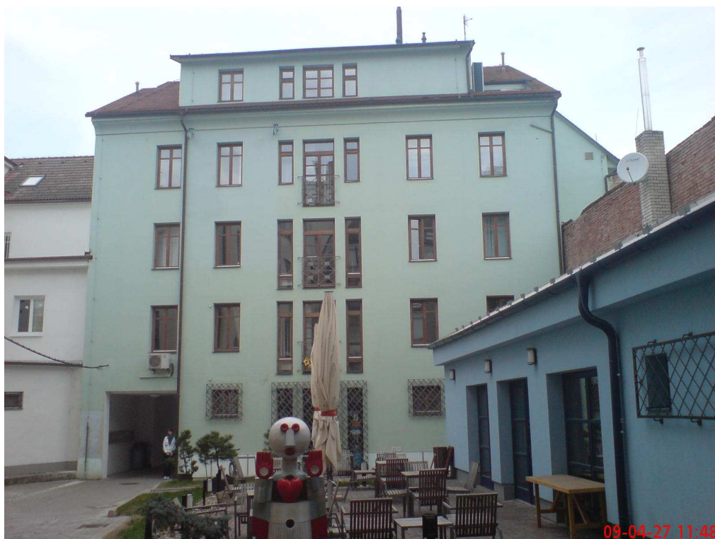
Obr. 1 pohled z atria na dům č.p. 1245

Dům č.p. 1245 stojí ve frontě domů na Zelném trhu. Je čtyřpodlažní s obchodním parterem a kancelářskými prostory v dalších podlažích. Architektonicky průměrný dům z 90. let 20. století je průchozí do atria společného z domem Portál přes průchod, ve kterém jsou umístěny kontejnery pro směsný odpad a technické vstupy do provozoven a poštovní schránky. Průchod je oddělen od Zelného trhu lehkou transparentní kovovou konstrukcí brány z ocelových jaklů a lexanu. Stejně jako v domě Portál se i tento průchod ve večerních hodinách uzavírá.