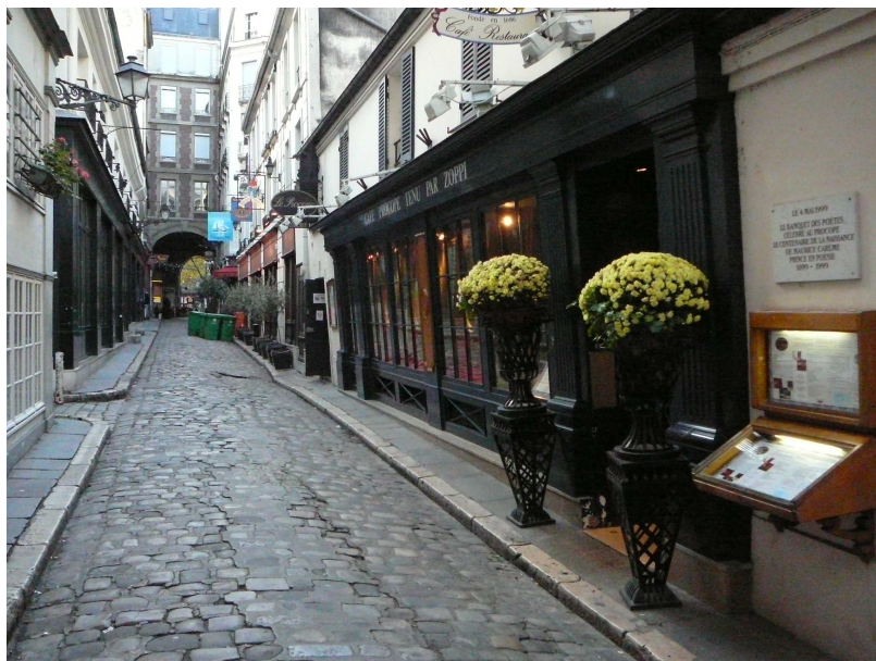
Obr. 9 Paříž, Cour du Commerce Saint André