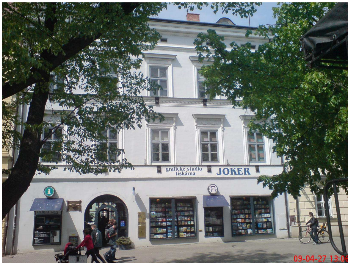
Obr. 1 Dům Portál, pohled z Masarykova náměstí

Zájmová lokalita se nachází v Uherském Hradišti na Masarykově náměstí.