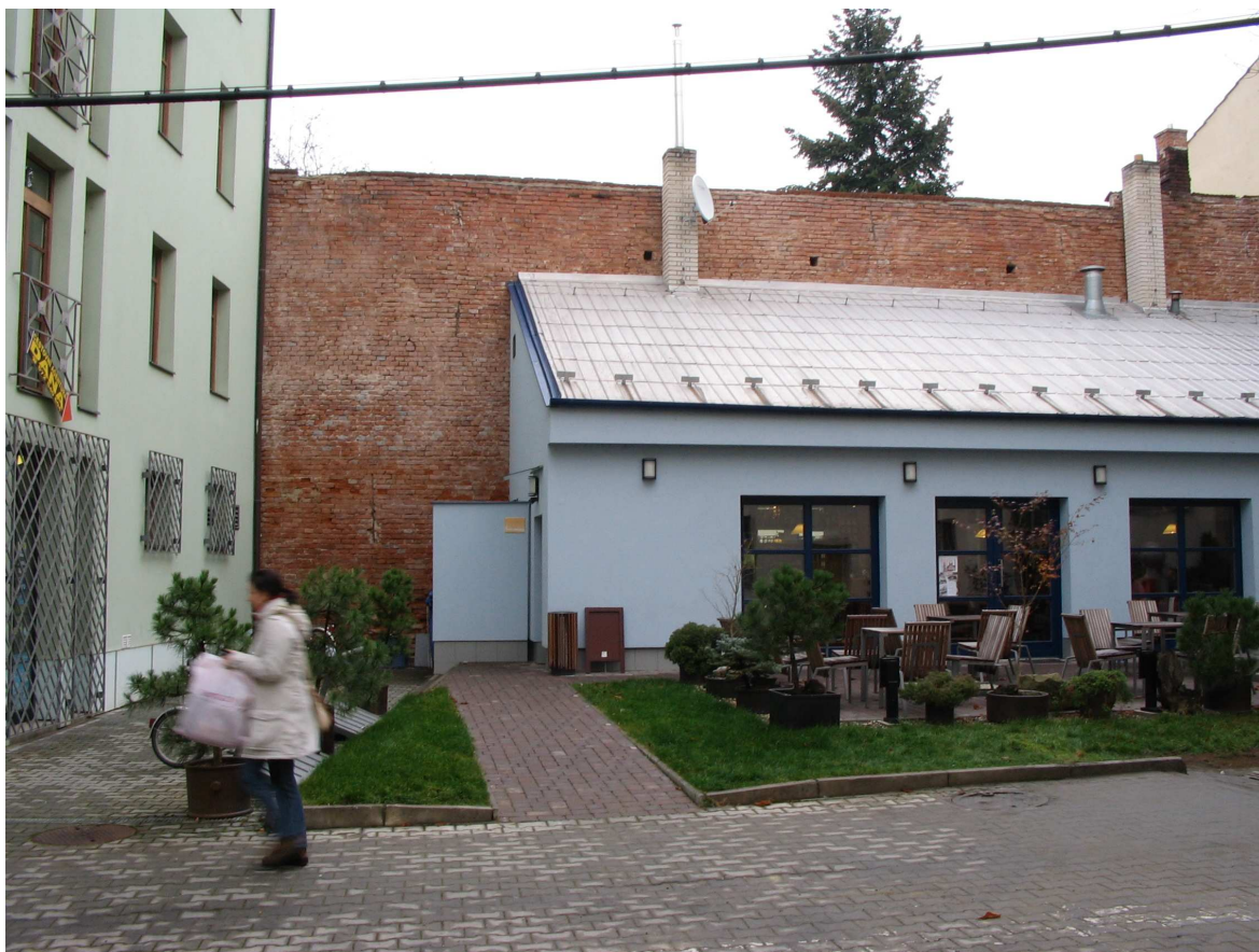
Obr. 4 objekt kavárny ve vnitrobloku