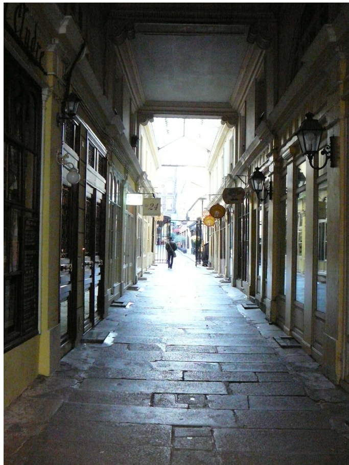
Obr. 8 Paříž, Cour du Commerce Saint André

prostor uvnitř parteru se navzájem „tuší“, jeden ví o druhém, jeden pro druhého jsou si vjemem k pozorování navíc podporujícího zvědavost – tuší, ale nevidí. V případě zasklení čirým sklem jde o klasický, úžasný vjem, pocit, který můžeme zažít na příklad v Paříži při procházce po rušném bulváru, kdy procházející na ulici dělí od „obyvatelů kaváren jen tenká tabule skla. V létě ani to ne. Intenzita vjemu je přímo úměrná zájmu procházejících. Zůstává tedy na každém jedinci, jak bude ovlivněn, zda bude používat průchody jako zkratku, nebo se nechá vtáhnout do děje.