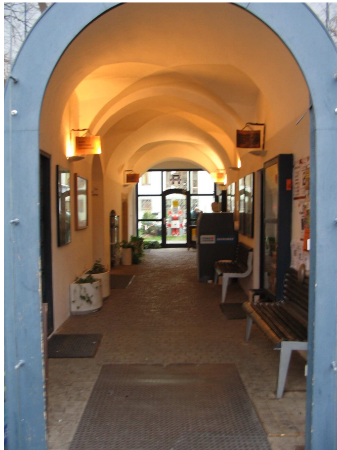
. Obr. 5 pohled do průchodu domu Portál z Masarykova náměstí

Z hlediska komunikace je jedinečná spojnice z Masarykova náměstí právě průchodem přes dům Portál č.p. 35 a dům č.p. 1245 s vyústěním na Zelném trhu. Jeho využití je omezeno denní dobou, protože průchod domem Portál je přiřazen k provozu domu a uzamyká se. Stejná situace je v domě č.p. 1245, průchod domem se uzavírá.