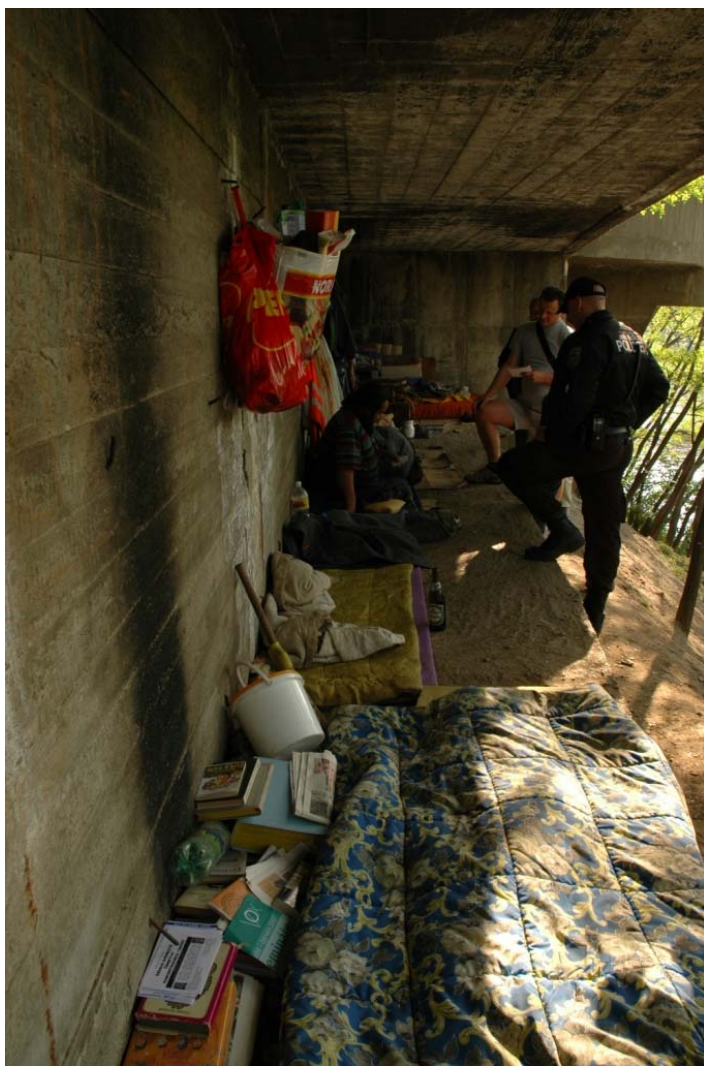
Obr. č. 5 – kontrola strážníků MP na Praze 5 pod mostem Inteligence (převzato z Analytické zprávy o bezdomovectví na území HMP v roce 2005)