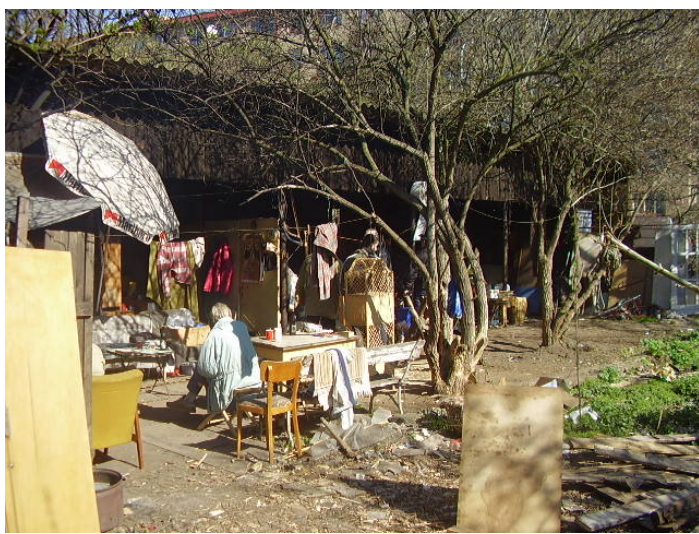
Obr. č. 3 – obydlí v Praze 5

Jako domov vnímají lidé ze SW své obydlí (4 a 5), i když jsou to jen stany a jejich okolí. Dvojice ve zděném objektu (6) však má až neuvěřitelně dobře zavedenou a zabydlenou domácnost, respondentka je tady dva a půl roku, její přítel dokonce pět let. Respondentka sem přišla hned po rozvodu. Lidé z opuštěné zahrádkářské osady zůstali na místě i po zbourání chatek, jen si pořídili stany, v chatkách bydleli tři roky (5), resp. jeden rok (4), tam jim „bylo dobře“. Ve všech třech případech je pocit domova, odpočinku a soukromí v obydlí vnímán silněji také vlivem osobních vztahů. Muži z DC nemají nikde pocit domova ani nemají žádné místo odpočinku, jen muž z vraku auta (1) pociťuje odpočinek a soukromí právě ve „svém“ vraku, ale nejlépe se cítí v denním centru. Muži z DC nevedou sexuální život, ten, kterého doprovází manželka, to komentoval slovy „je mi líto manželky, ale ne“. Ve SW tato otázka nebyla položena.