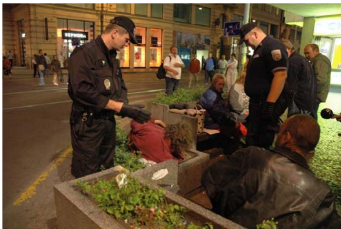
Obr. č. 2 – kontrola strážníků MP na Václavském náměstí