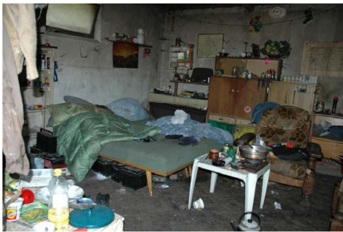
Obr. č. 4 – obydlí v Praze 5

bývalá osada Bud'ánka (převzato z Analytické zprávy o bezdomovectví na území HMP v roce 2005)