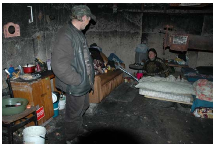
Obr. č. 6 – bydlení v Praze 5, bývalá cihelna (převzato z Analytické zprávy o bezdomovectví na území HMP v roce 2005)